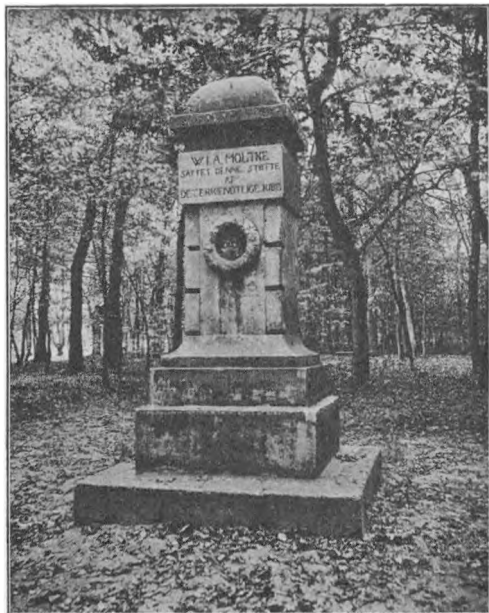
Fig. 3. Moltkes Æresstøtte ved Ribe.

satte Græstørv langs med Kanten. Havfloden maatte blive overordentlig høj, dersom den nu skulde forhindre Folk i at kunne komme til og fra Byen. Til Vejens Fyldning medgik 42,180 Læs Sand, Grus og