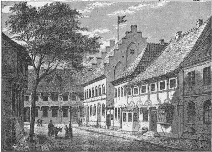
Fig. 5. Stenbogade i Ribe. Efter Illust. Tid. 1871.

slog derfor, at Byens Kasse afholdt den, saa længe alle andre Bekostninger ved de almindelige Landeveje bares af den. Det synes, som om Resultatet er blevet, at Udgifterne ved Anskaffelsen lagdes paa Grundtaksten, medens Udgiften ved Pasningen m. m. afholdtes af Byens Kasse. 1