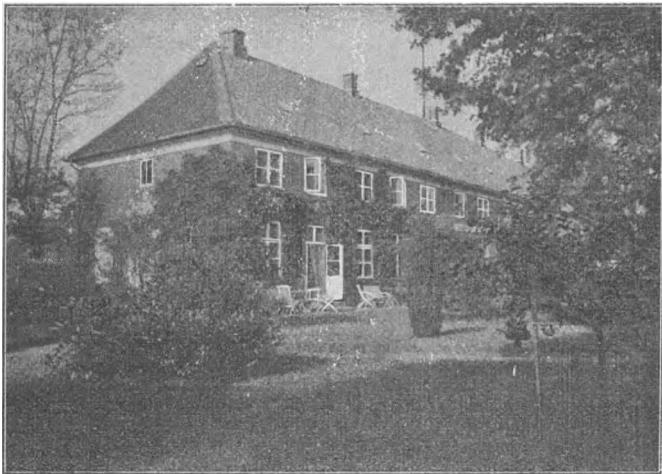
Fig. 2. Parti af Stiftamtsgaarden i Ribe, opført 1797. Set fra Haven.

Korsbrødregaard, der imidlertid var saa forfalden, at dens Ejer noget senere saa at sige helt lod den bygge op fra Grunden af. Moltke maatte da, foreløbig for egen Regning, bygge den nuværende Stiftamtsgaard, der først ved kgl. Resolution af 9. December 1801 blev Embedsbolig. Paa et Solur paa Bygningens Sydgavl staar: „Denne Gaard er bygget 1797 af W. Moltke og