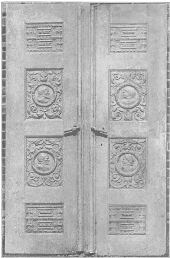
Dør fra det gamle Kærgaard.