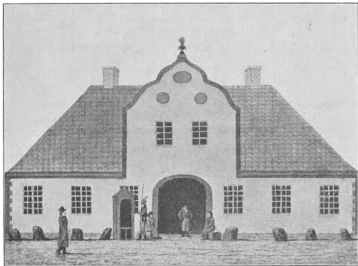
VAGTBYGNINGEN I RIBE 1808. 2

og Gjesten i Ribe Amt, C. F. Junghans, giver 1 det Mandskab af Regimentet Princessa, som fra 29. Marts til 5. April var indkvarteret i Sognet, det bedste Skudsmaal: „Meget skikkelige og beskedne var de, ikke en Uorden, end ikke den mindste, mærkedes hos dem“. Endnu skal som udtrykkeligt Bevis for det gode For-