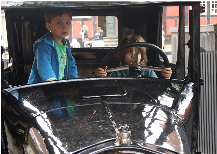
Drenge bag rattet i en Ford T. I automobilforretningen og -værkstedet Carl Christensen kan man røre og prøve forskellige ting.

I firmaets anden bygning, en ældre bindingsværksbygning, der ligger lige ved siden af, står en Chevrolet, hvor publikum ved at dreje på håndsvinget får fortalt en filmisk historie om, hvad de enkelte værktøjstyper blev anvendt til.