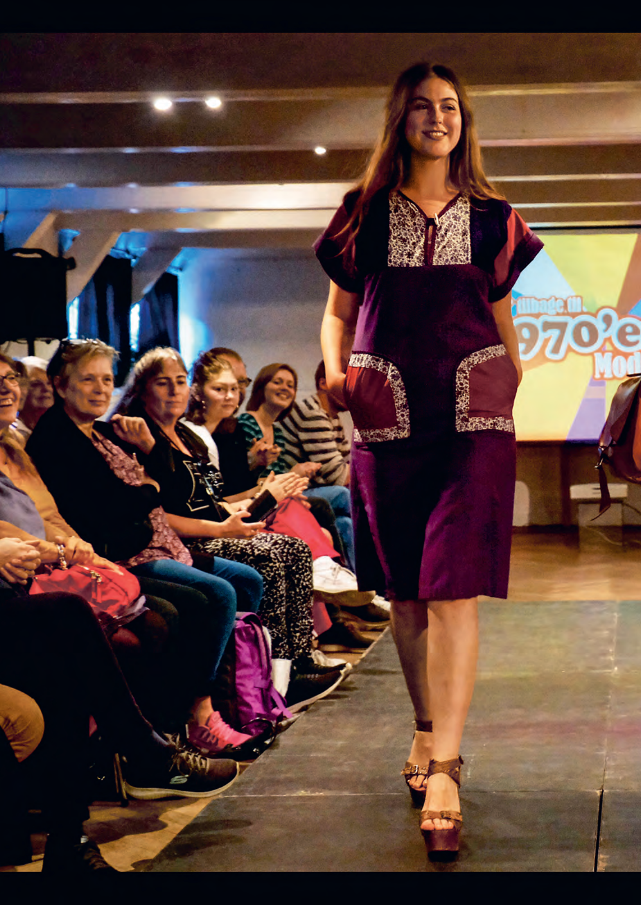
Image III 970's Mod