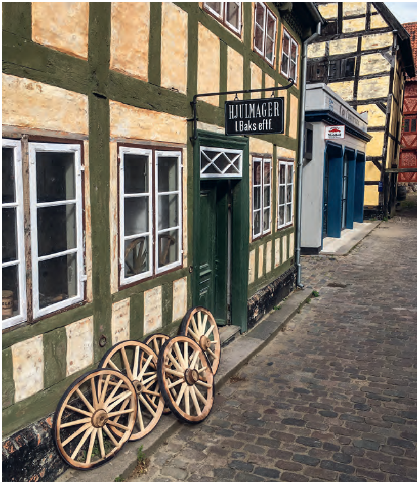
Fem færdige hjul foran det midlertidige hjulmagerværksted i Randershuset i Den Gamle By.

For mange håndværk gælder det, at kundskaben forsvinder og dermed en vigtig del af vores kulturarv. Et håndværk som hjulmagerfaget er svært at praktisere på markedsvilkår, da efterspørgslen er faldende, og det vil være svært at få økonomi i faget. Ved at varetage faget i Den Gamle by, kan vi tilføje det en ekstra dimension, som en selvstændig håndværker aldrig vil kunne, nemlig formidling. Vi kan i Den Gamle By se, at der er stor interesse for gamle håndværk, og mange af processerne i fremstilling af hjul er både spændende og nemme at forstå. Vi har vores egne vogne og kærre, vi skal holde kørende, men der er også perspektiver i at bruge vores kompetencer til at hjælpe andre museer og vognentusiaster med at holde de traditionelle hjul rullende.