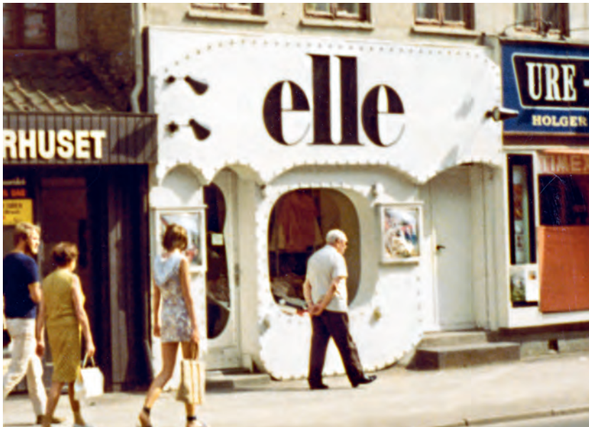
Elle Boutique, Nørregade 21, 1971.

Elle Boutique i Nørregade ledte med sin hvide facade i runde for-