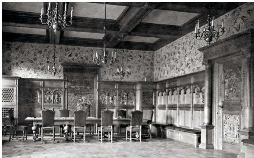
Laugssalen i Paradisgade omkring 1932.

dykkere. Ved forsigtigt at lirke listerne af kom vi ind til skruer, der fastholdt laugsskilte, plader og gesimser til væggene. Så i løbet af et par dage var vi klar til at sende løsdelen og møbler med flyttemænd til en midlertidig oplagring.