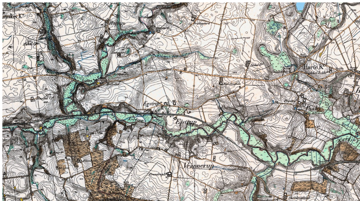
Kort over Højrup og Ejstrup, Højkantkort 1840-1890