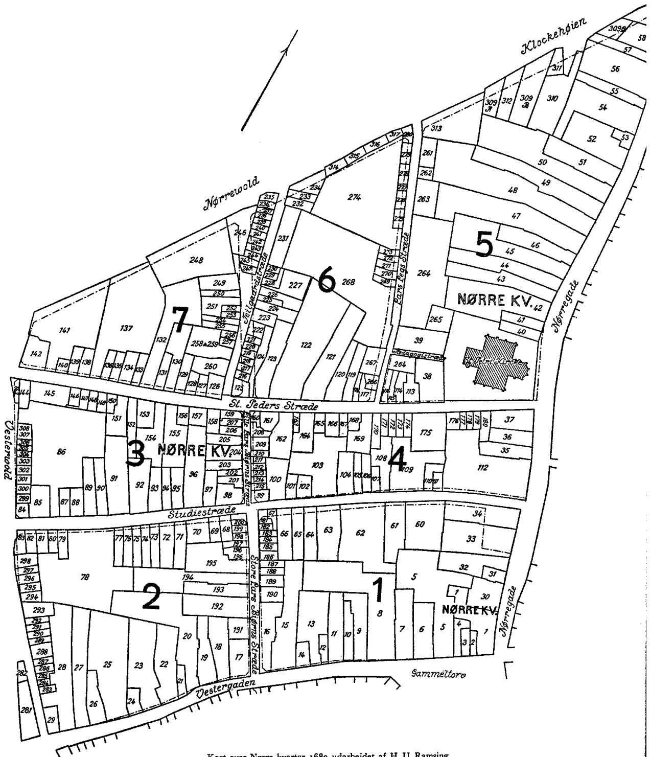
Kort over Nørre kvarter 1689 udarbejdet af H. U. Ramsing.