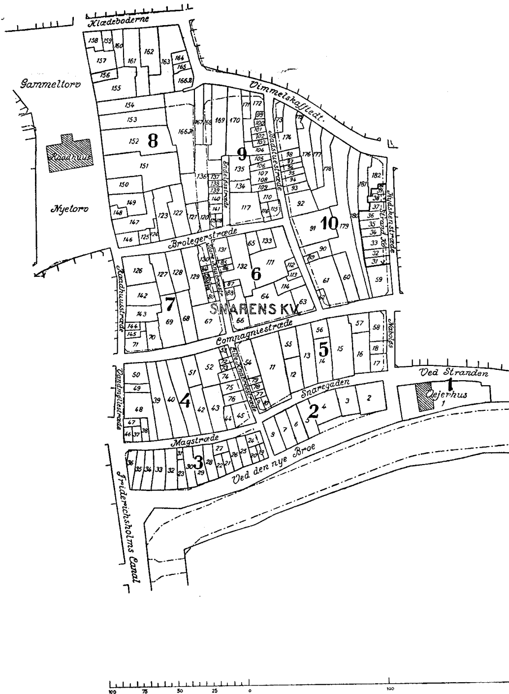
Kort over Snarens Kvarter 1689 udarbejdet af H. U. Ramsing.