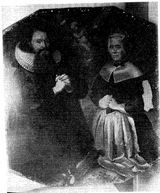
Haslund Kirke, Galten H. Randers Amt.