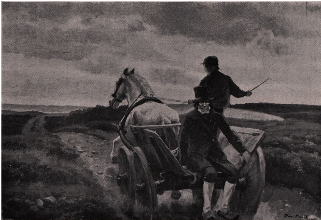
Hans Smidth (1839–1917): Hjem fra Marked. (Privateje)

Bonden med den lange Vej til Marked og ingen Rutebiler — eller Selvejer — betegner et Udsnit af den økonomiske Udvikling: Økonomien betyder ikke mere Bytte, men Penge, og Handelen maa passes — men Samfærdselsteknikken er endnu ikke naaet rigtig med.