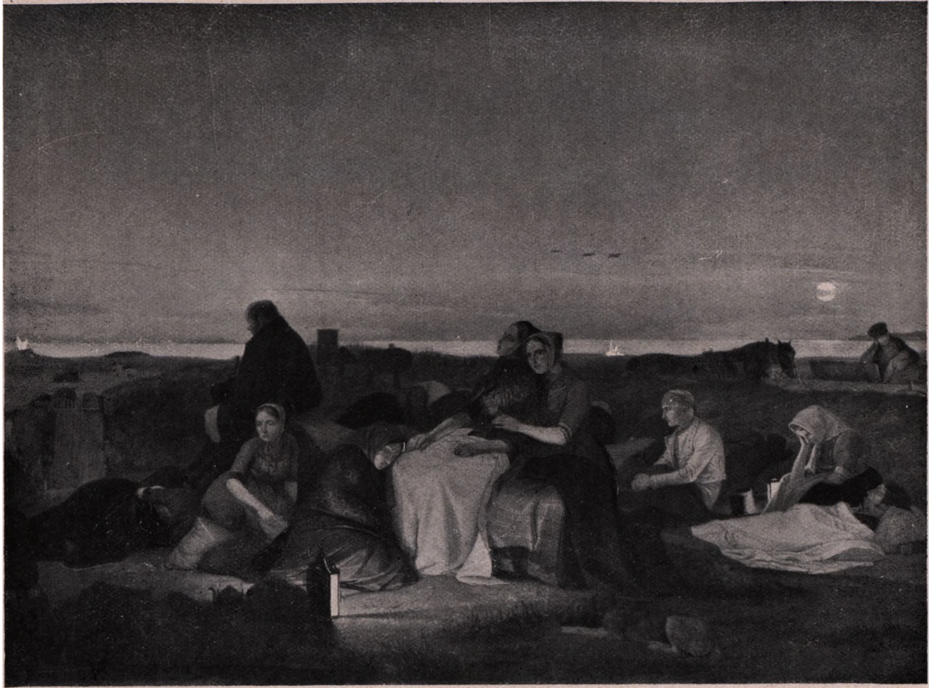
Jørgen Sonne (1801—1890): Sankt Hans Nat. (Statens Museum for Kunst).