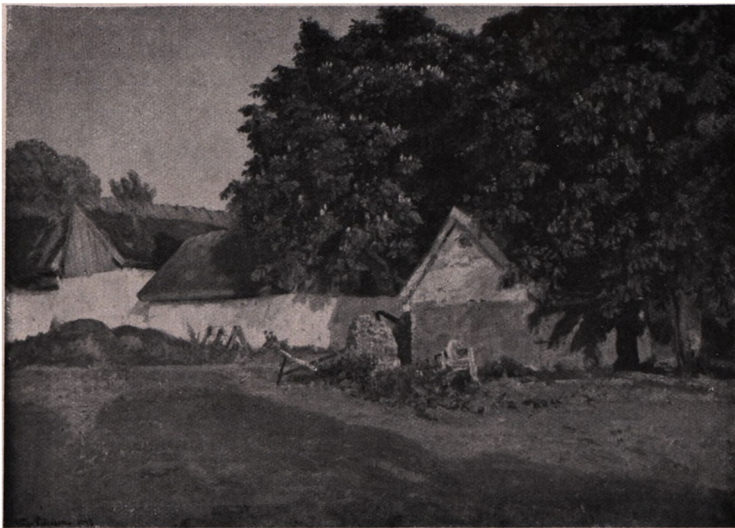
Viggo Pedersen (1854—1926): Ved Bondegaarden. (Hirschsprungs Museum).