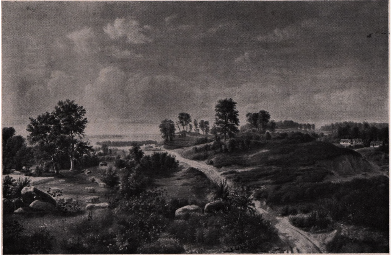
Danqvart Dreyer (1816—1852): Landskab. (Statens Museum for Kunst.)