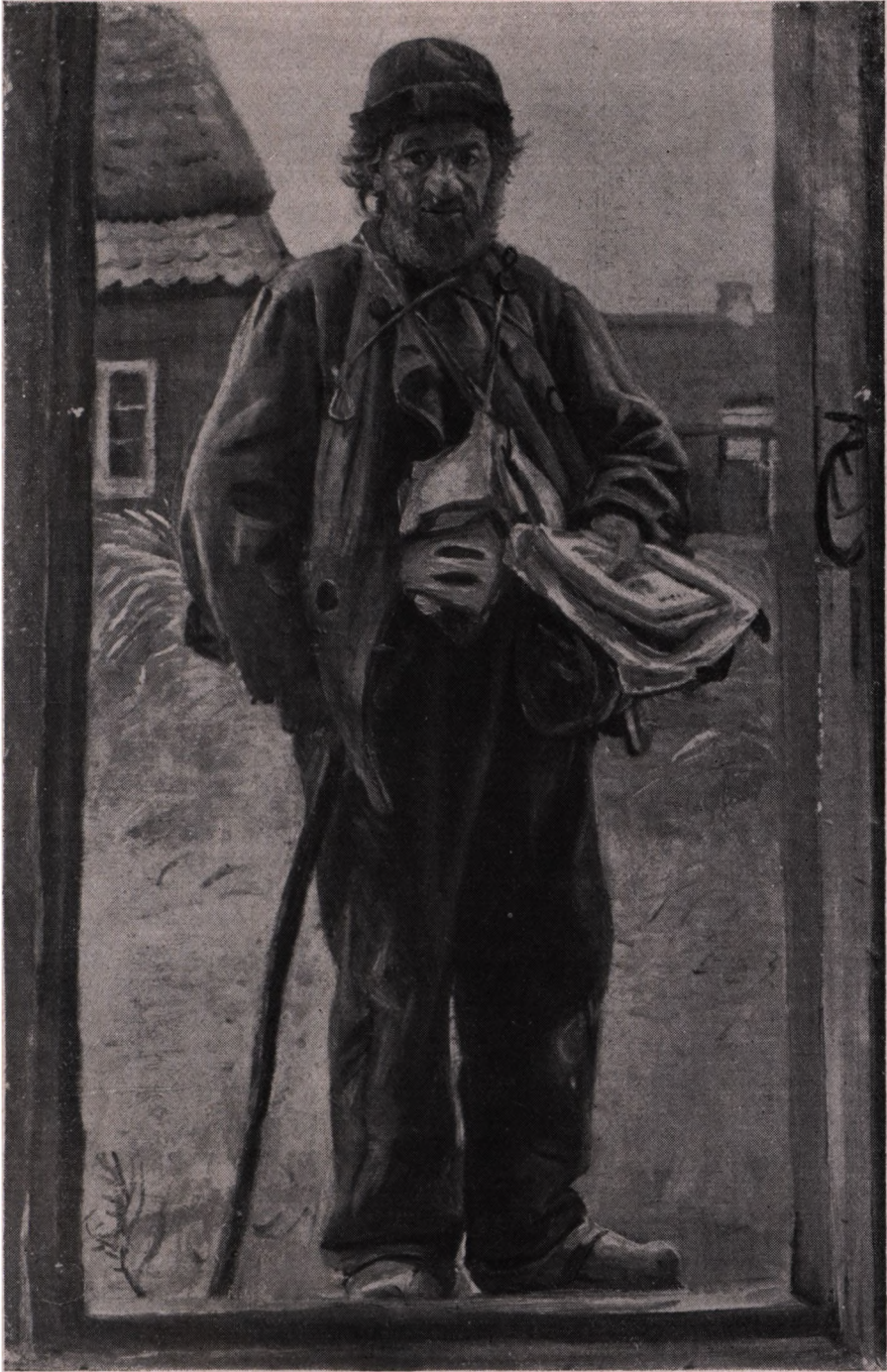
M. Ancher (1849—1927): Visesælgeren. (Skagens Museum).

Landposten tilfods med Stokken i Haanden og Tasken med Aviser var vor Barndoms daglige Oplevelse. — Men 'en Forløber var Visesælgeren! Visen om Mordet i Naboherredet og Tidens andre dystre og oprivende Begivenheder sat i en Form, de kaldte paa Rørelsen, eller andre Følelser — en bestemt Side af Journalistikken i dens Begyndelse!