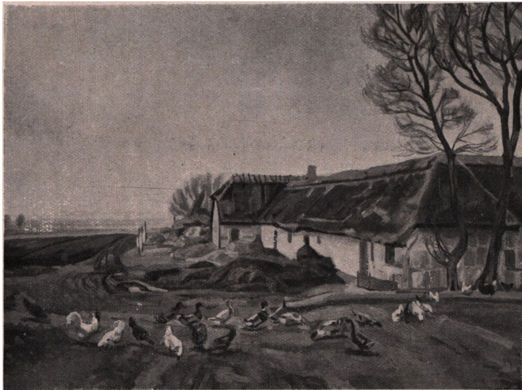
F. Syberg (1862—1939): En Bondegaard. (Privateje).