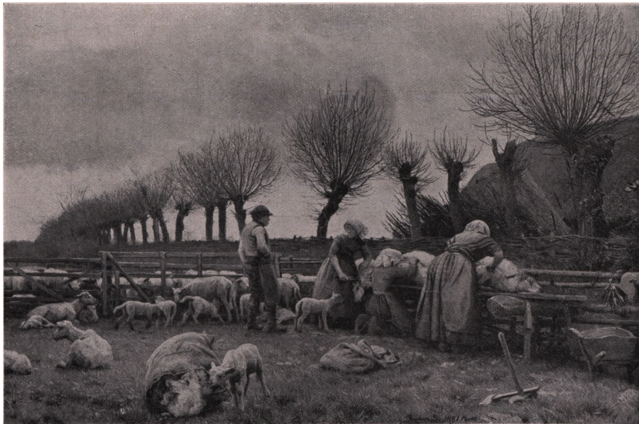
Joakim Skovgaard (1856—1933): Faareklipping paa Lolland. (Hirschsprungs Museum).

En svunden Tid: Lollands kostbare Jord Græsgang for Faar! Utænkeligt nu, men et Afsnit af en Udvikling — og et skønt Billede af det gamle Lolland med stynede Pilehegn og flettede Gærder.