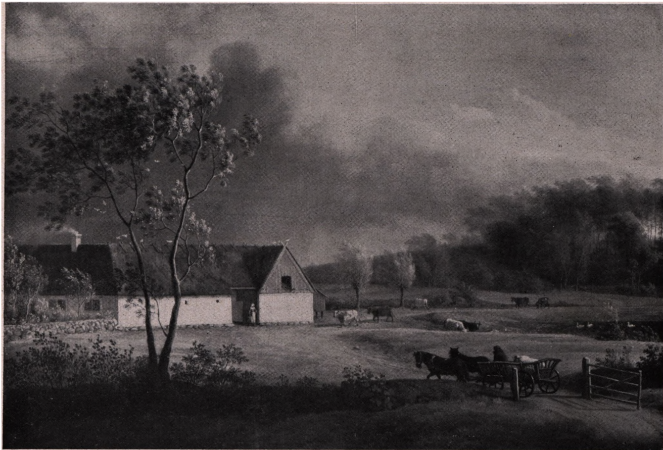
Jens Juel (1745—1802): En sjællandsk Bondegaard under et optrækkende Uvejr. (Statens Museum for Kunst).