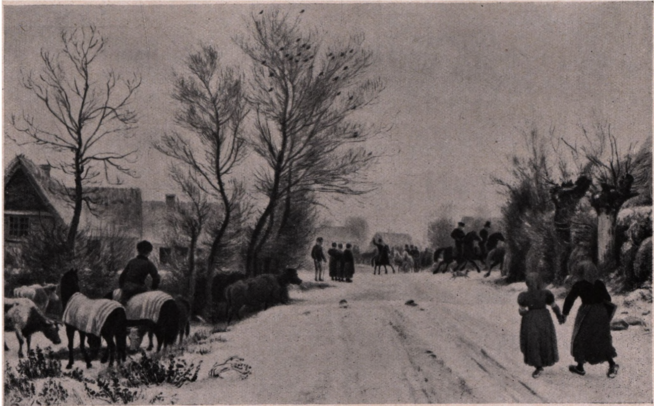
P. C. Skovgaard (1817—1875): Vinterdag. (Hirschsprungs Museum). Et Bondebryllup med Forridere og Fest i Landsbygaden.