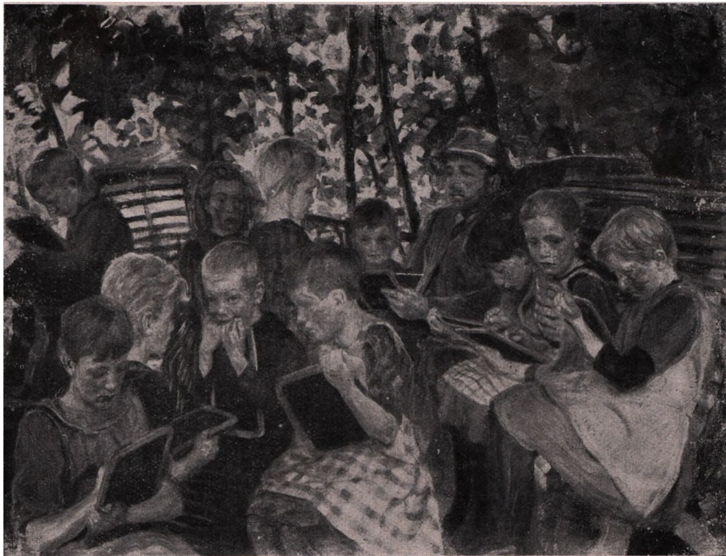
Peter Hansen (1868—1928): En Landsbyskole. (Faaborg Museum).

Klassen er flyttet ud i Haven, hvor det erfaringsmæssigt er vanskeligt at holde paa Opmærksomheden. Men Billedet er typisk for den lille Landbyskole: Det nære Samarbejde mellem Lærer og Børn, det teknisk primitive Apparat, de „hjemlige“ Forhold.