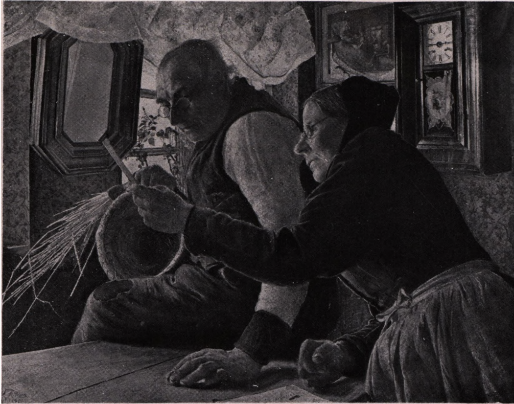
L. A. Ring (1854—1933): De gamle har faaet Brev. (Privateje).

De to gamle, der har faaet Brev fra Sønnen eller Datteren derude, er et Billede, som hører 19. Aarhundredes Bondeliv til. — Der var Ømhed, Længsel, Stolthed og Uro i Følelsen over for dem, der rejste ude; det var Baand, der var søde at mærke, og dog pinefulde — og en Dag brister de!