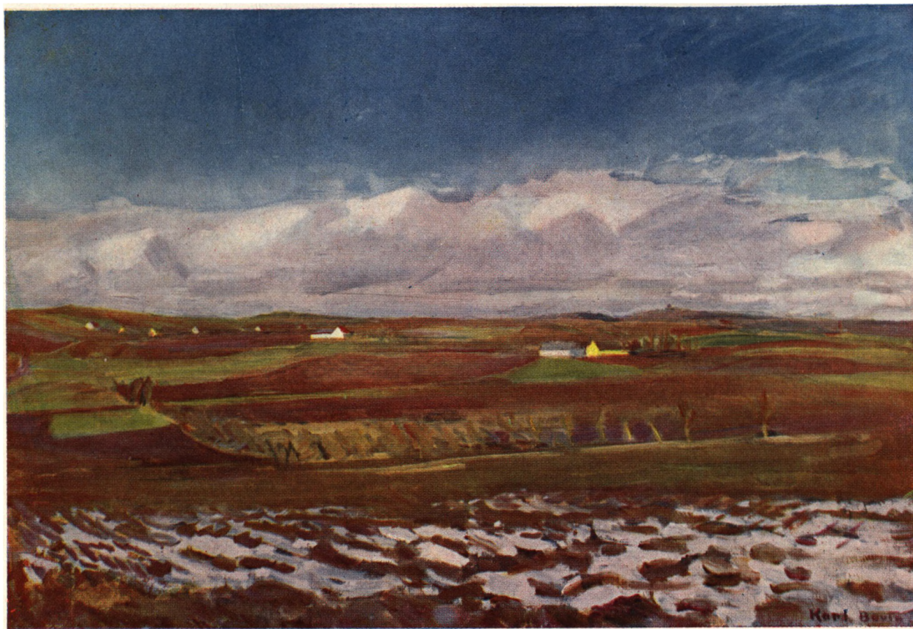
Karl Bovin: Vinterbillede. Tilhører: Grosserer Veith.