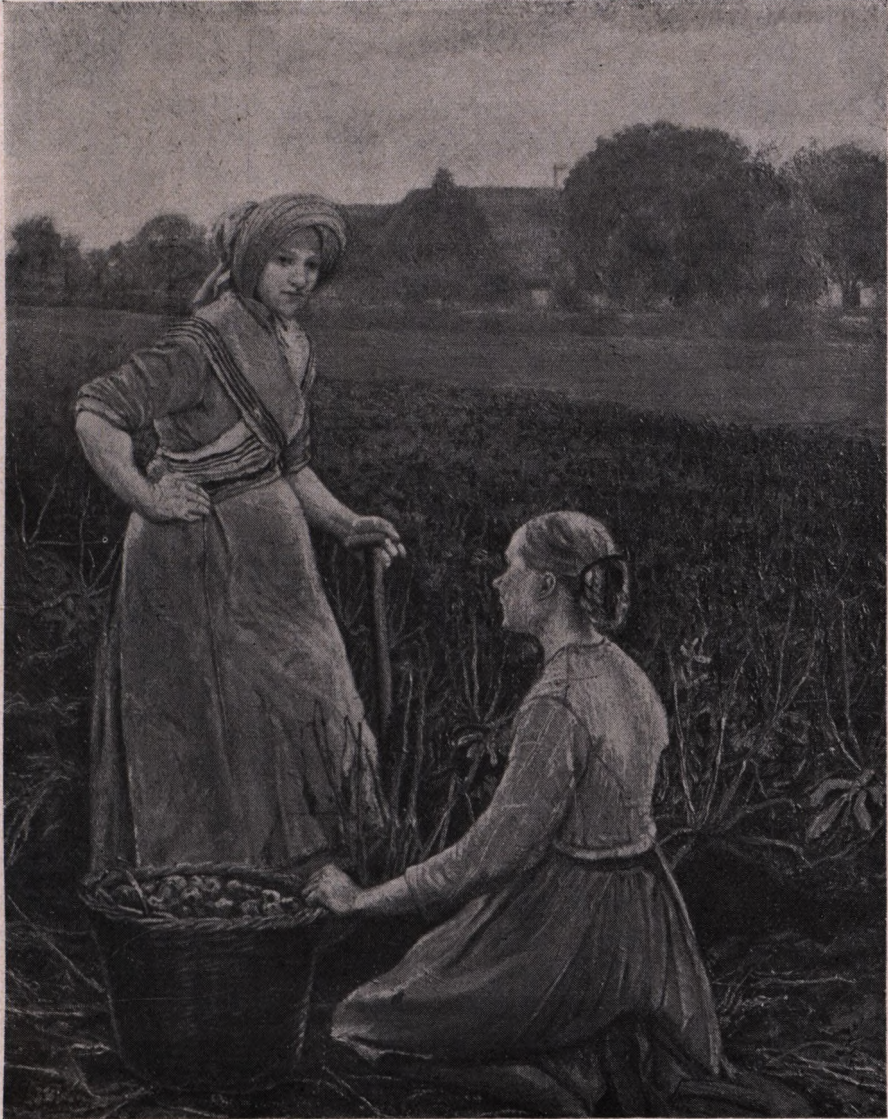
L. A. Ring (1854—1933): Kartoffeløpgravning. (Hirschsprungs Museum).

Kvinderne i Kartoffelageren er et Udsnit af Overgangstiden: i moderne Landbrug er der lange Kartoffelagre — men endnu er det Kvinderne, der tager dem op. Tiden omkring 1900.