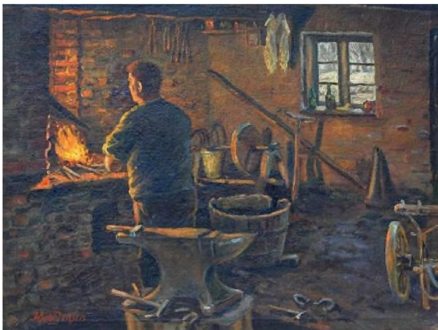
Maleri af Keld Jensen: Smeden i arbejde.