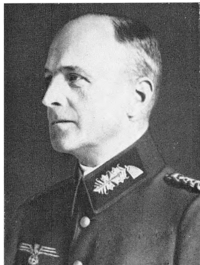
Generalfeltmarskal W. von Brauchitsch (1881–1948) var 1938–41 hærens øverstkommanderende.