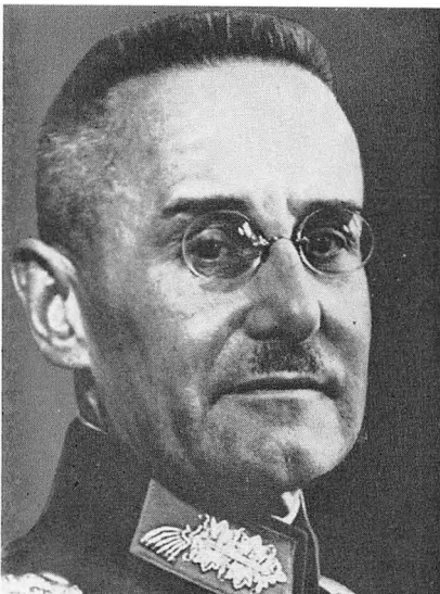
Generaloberst F. Halder (1884– ) var hærens generalstabschef 1938–42.