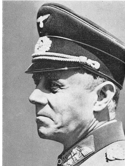
Generaloberst Ludwig Beck (1880–1944, selvmord 20. juli) var 1933–38 hærens generalstabschef og i den første krigsvinter en fremtrædende skikkelse inden for Hitler-oppositionen.