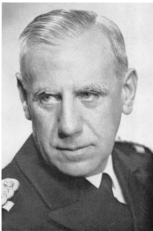
Admiral W. Canaris (1887–1945, henrettet 9. april) var chef for efterretningstjenesten 1935–44.