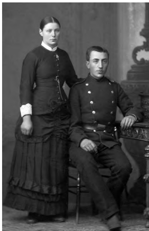
Billeder registreret 27/12-1883 v. Tønnies.