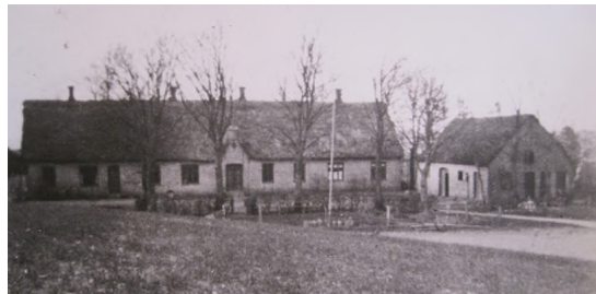
Hylke Fattiggård i Baadstrup – ca. år 1900

- Hun var sidste fattiglem på gården, der lukkede et par måneder efter hendes død.