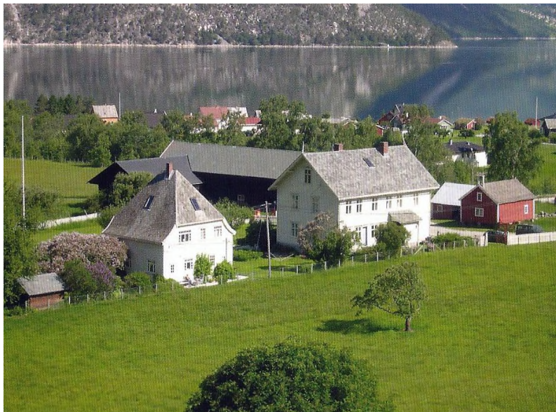
(Gården Natvik i Vikadalen.)