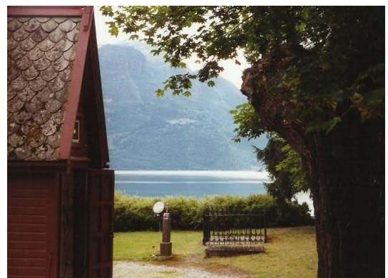
(Lusterfjorden set fra Dale kirke)

Der hvor Europas længste fjord, Sognefjorden, strækker sig ind over landet i mødet med Jostedalsgreen og Jotunheimen, ligger Luster kommune. Luster, som er mellem de største kommuner i Syd-Norge, er en fascinerende del af Norge. Et vestland i miniature med smukke fjorde, bratte fjelde, vandrige fossefald, blå breer og frodige dale. De omkring 5000 indbyggere i kommunen har landbrug, frugt- og bær dyrkning, industri, elkraftproduktion, rejse- liv og privat og offentlig service som levevej.