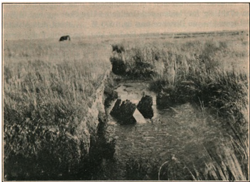
Egepælene staaende i Bredmose.

Henved 4000 M. længere mod NØ. — paa den anden Side af Landsbyen Uge — ligger det nu opdyrkede Tylsbjerg (paa vort Generalstabskort [urigtigt?] kaldt Todsbøl Bjerg). Vejen fra Povlskro og