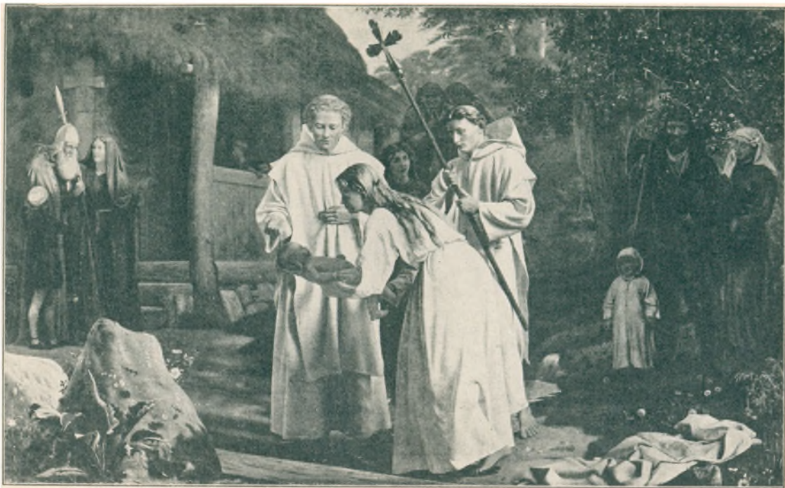
Chr. Dalsgaard: Ansgar døber en ung moder og hendes lille barn.