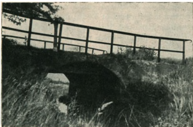
Galgebroen ved Bredevad.

N aar man fra Korsvejen ved Bredevad, hvor Aabenraa-Tønder og Tinglev-Løgumkloster Landeveje skærer hinanden, vandrer et Par Hundrede Meter mod Vest, drejer den gamle Landevej, som blev nedlagt for en halv Snes Aar siden, fra i en spids Vinkel til