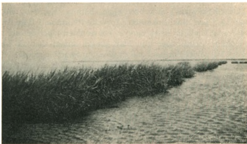
Skrædderklinten: Planter fra 1931 og 1932, fot. 1935.

Men selv om denne Vanskelighed er til Stede, skulde den egent-