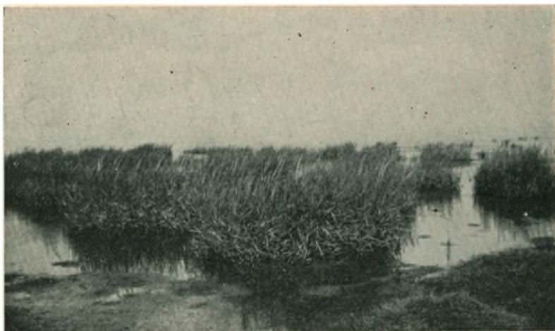
Ballum: Planter fra 1932, fot. 1935.

Man fik her rigtig Lejlighed til at se, hvorledes Slikafsætning