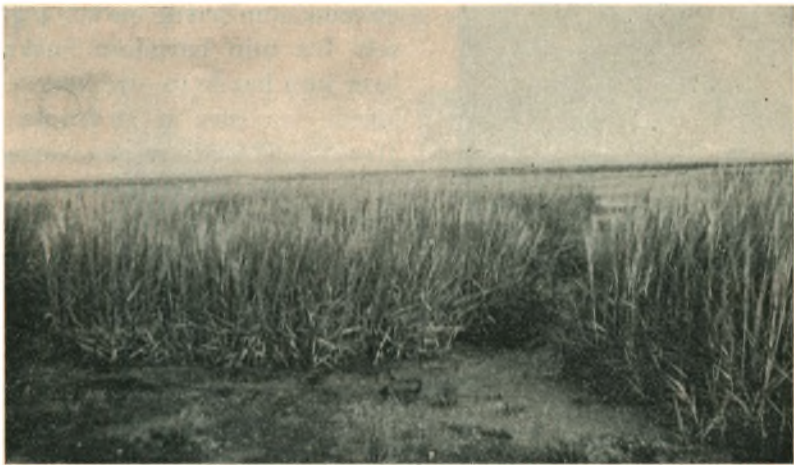
Fanø: Planter fra 1931, fot. 1935.

Men Spartinagræsset maa ikke nøjes med at værne særlig udsatte Steder. Det maa selv skabe nyt Land. Forholdene er nemlig saaledes paa store Dele af Vadehavet, at det kan. Især indenfor Øerne Rønø, Manø og Fanø, hvor der ligger store Slikvader, og hvor de unge Planter kan faa rolige Voksesteder, maa der være gode Betingelser for at skabe udstrakte Spartinaenge som i Udlandet. Men