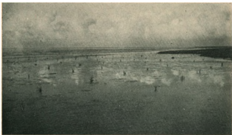
Ballum: Planter fra Foraaret 1934, fot. Oktober 1934.

De bedste Voksesteder findes, hvor der er dyb Slik, og denne har en saadan Højde, at den ligger tør 2—3 Timer ved Ebbe. Men selv paa mager Slik trives Græsset dog ganske godt. Derimod kan