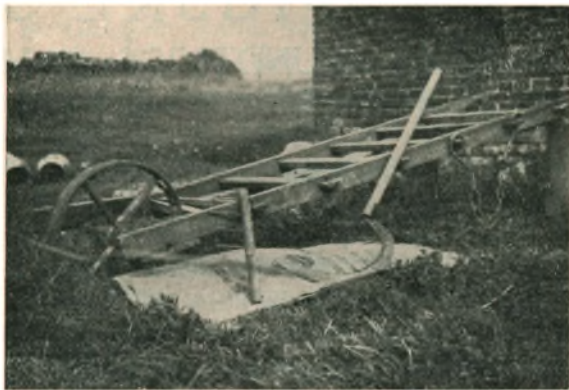
Den »lang' Kårre« (lange Trillebør), »Kradseren«, Seglen og Lænken.

»E istag« blev bjerget om vinteren. — Hvis vandet ikke var tillagt med is, skar vi »e istag« fra baaden. — Med en segl blev den skaaret af rundt om baaden, og efterhaanden samlede vi det afskaarne i venstre arm. — Hvert knippe blev dypet ned i Vandet, saa at »e bloes« gik af. — Naar dette senere løb sammen til bunker