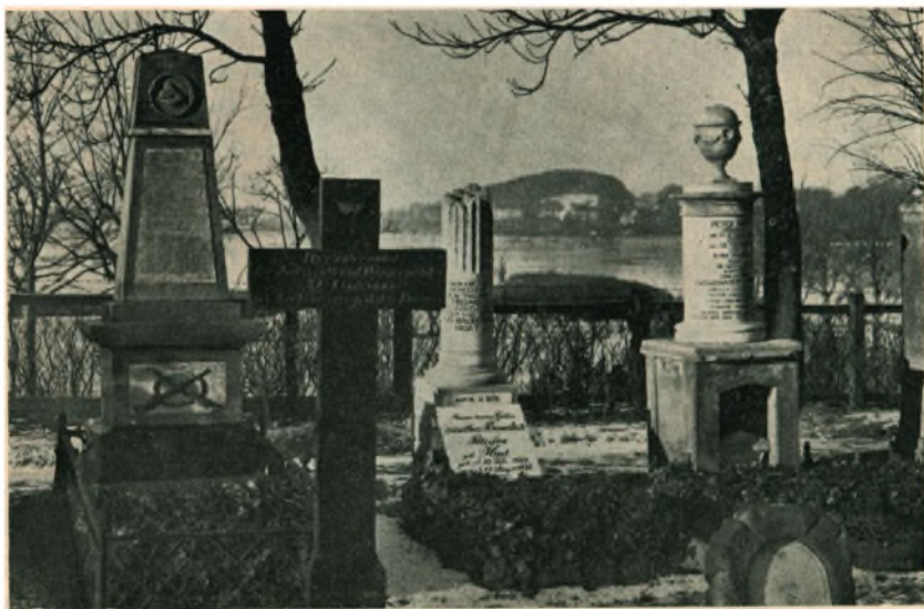
Udsigt fra Klosterkirkegaarden ud over Haderslev Dam til Bøghoved i Baggrunden.