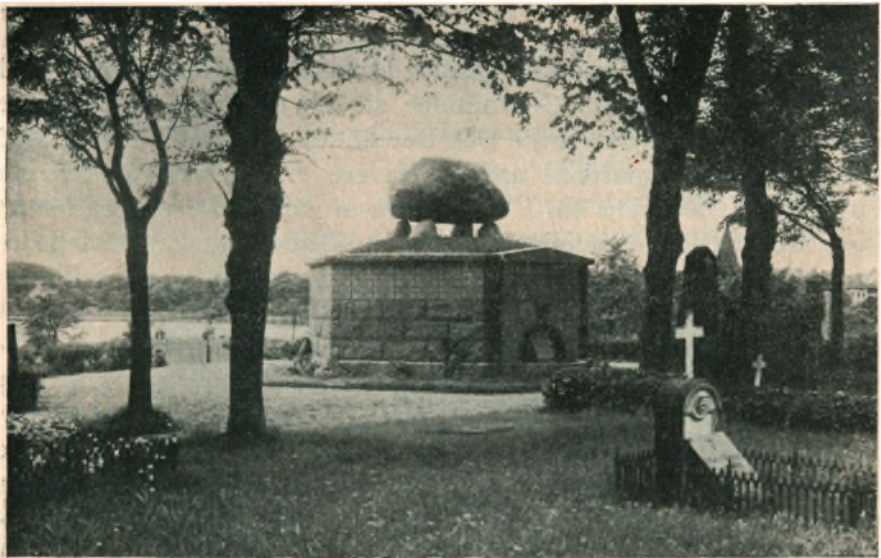
Mindesmærke for Domsognets dansksindede Faldne i Verdenskrigen. Set inde fra Klosterkirkegaarden.