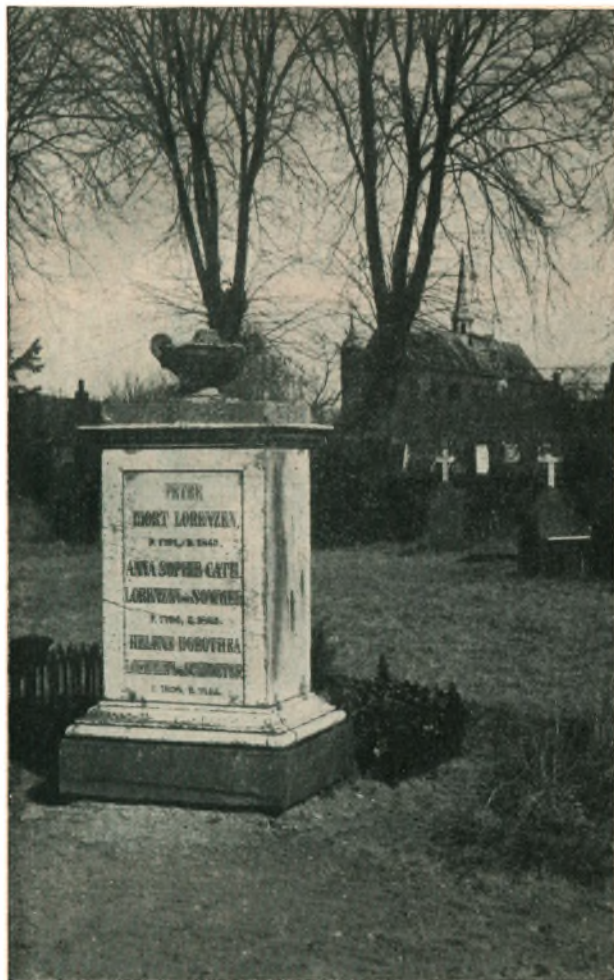
Peter Hiort Lorenzens Gravsted.

derdeputeret Pæ- ter Hiort Lo- renzen, hvis Navn og Virke al- drig vil blive glem- t her i vor Lands- del. Han døde 17. 3. 1845, 54 Aar gammel i sin Fø- deby, hvor han fødtes 24. 1. 1791. Hans Gravsten blev allerede for flere Aar siden, vistnok som den første paa Kirke- gaarden, rensed og Indskriften op- trukket med Guld og staar nu som et smukt Minde om denne fortjente Hædersmand. Den herværende Afde- ling af Odd Fellow Ordenen har taget Navn efter Hiort Lorenzen, og lej- lighedsvis lægger Logen Blomster