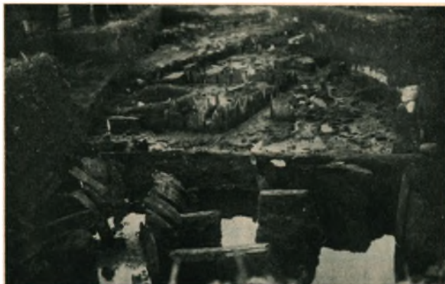
Fra Hedeby-Udgravningen 1935: Hustomter ved den Aa, der delte Byen.

I Fortsættelse af de tidligere Udgravninger har man i Løbet af Efteraaret 1935 gravet paa det lave Omraade ned mod Selk Nor, paa begge Sider af den Aa, der løb midt igennem Byen og delte den i en nordlig og en sydlig Del. Ogsaa der stødte man overalt paa