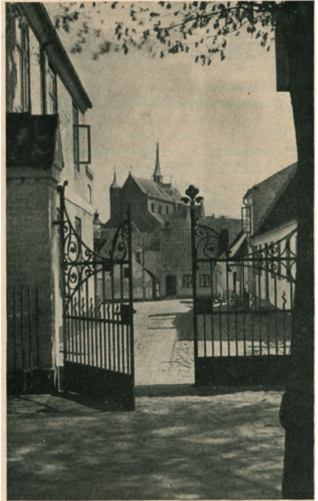
Porten mod Præstegade.