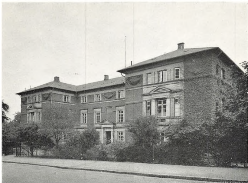
Gl. Bakkehus, hovedbygningen.