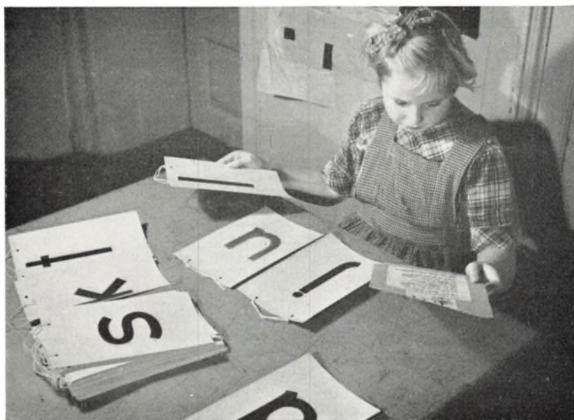
Stavingens kunst er svær.