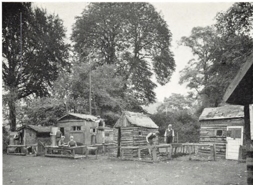
Skrammellegepladsen på Gl. Bakkehus.