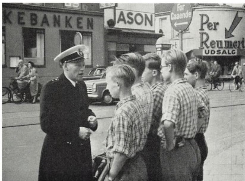
Elever fra Gl. Bakkehus får færdselsundervisning.