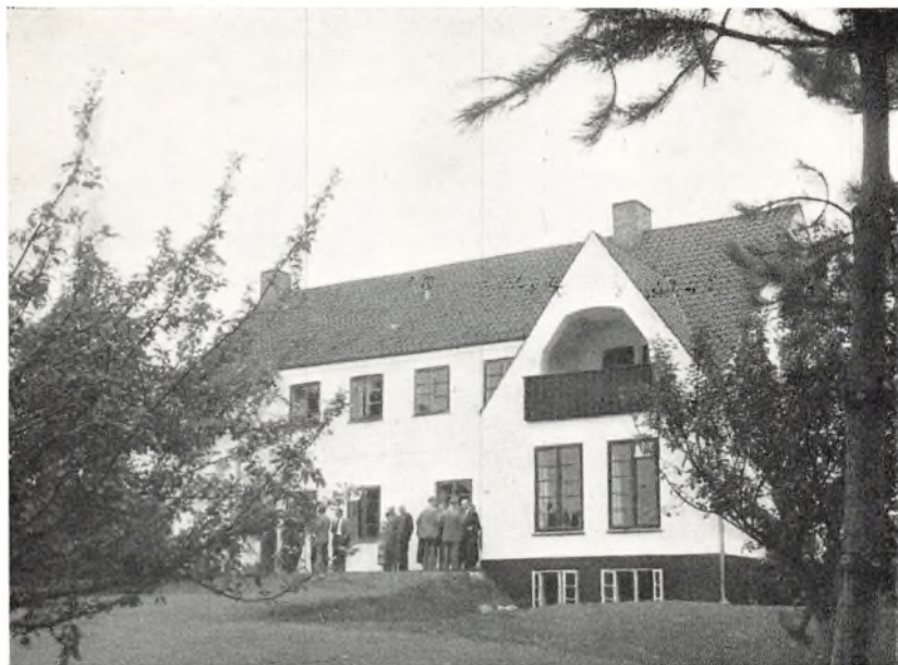
Skolen ved Skarridso.