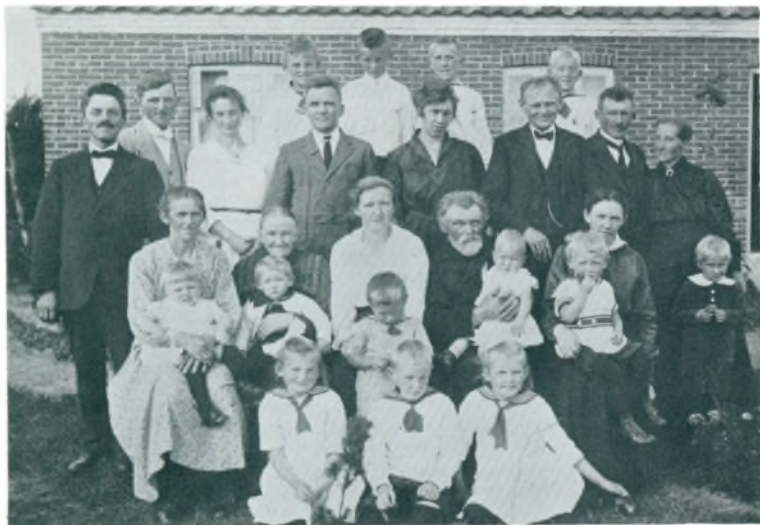
Familien samlet ved hjemmet i Ho 1921