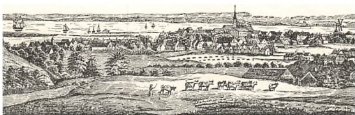
Aabenraa ca. 1830.