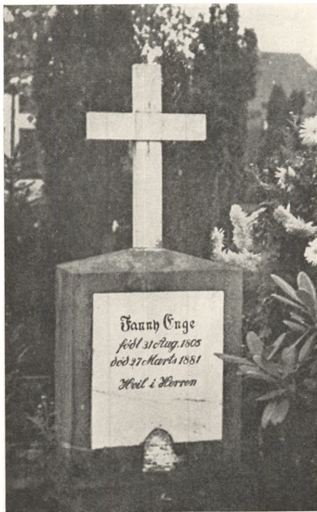
Fannys Grav paa Aabenraa Kirkegaard.