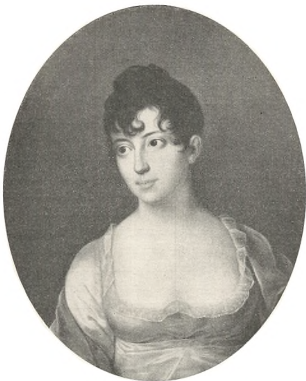
Prinsesse Charlotte af Danmark gift med Kronprins Christian, den senere Christian 8.