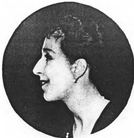
Karen Blixen - ca 1940

Jeg nåede desværre ikke at fortælle min mor om mine opdagelser - hun døde et par år før jeg fandt ud af, at vi slet ikke var i slægt med Karen Blixen; men det var ellers tæt på.