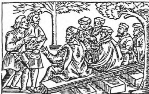
Et tingsted (efter Olaus Magnus, 1555)

Det betød, at hver eneste gang, der blev udskrevet ekstraskat, og det skete mange gange, både under Chr. IV og sønnen Fr. III, så måtte furboerne i gang med at søge om nedsættelse. Det skete i form af et eller flere tingsvinde, som blev udformet på det lokale birketing under den lokale birkefoged, assisteret af tinghørerne og birkeskriveren. Og disse tre personer bekræftede dokumentet ved at besejle det, idet den nederste kant af papiret blev