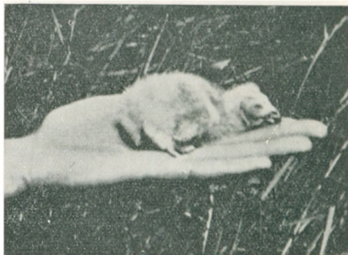
Moseuglens bløde, blinde Unge løftet op af Reden. De Slørugleunger, som kan findes i enkelte Kirke-tærne, er endnu finere og mere søre.

I en umaadelig høj Lade i en Bondegaard af frisisk Art, beregnet til Enghø i store Oplag, opdagede man i Rudbøl Sløruglens Rede. Paa to Maader fik man Vejledning til denne Rede. Paa Ladegulvet og i Vognporten laa der paa en temmelig lille Plet mange sorte, ret bløde Klumper af Form og Størrelse som Dueæg. Og en Dag laa der ogsaa en snehvid Dununge paa Gulvet. Den var styrtet ned og dræbt, laa med udstrakte lange Ben og slappe Øjne i det gammelkloge Ansigt med det krummede Næb.