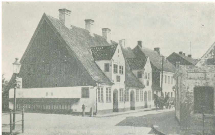
Schwennesens Stiftelse ved Sønderport

dem. Særlig grelt syntes man, at det var, at nogle af løjtingerne førte skibe tilhørte svenskere, idet fortjenesten da gik til udlandet. Aabenraaerne anmodede i dette tilfælde om, at skippere, der endnu ikke virkelig boede paa landet, skulde flytte til byen, og at det i fremtiden skulde være enhver skipper forbudt at slaa sig ned paa landet.