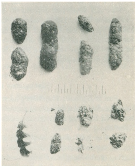
Gylp af forskellige Ugler (fra oven til venstre: 1) og 2) og 3) af Slørugle. 4) og 5) og 6) af Moseugle. 7) Fjer af Kirkeugle. 8) og 9) og 10) og 11) Gylp af Kirkeugle. 12 og 13) af Natugle. (Mærk Centimetermaalet i Midten.)

Medens Spidsmusen er klædt i den tætteste Pels af kulsort Fløjl, der kan taale at slæbes gennem trange Jordhuller, er dens eneste rigtige Fjende, Sløruglen, paaklædt med den letteste, mest ømfindtlige, dunagtige Fjerklædning i ganske sarte gullige og perlegraa Farver med dæmpede Draabepletter. Naar Spidsmusen kommer frem midt i Græstykningen for at gøre en graadig Jagt paa Regnorme og Biller, saa svæver Sløruglen med spændte Høresanser over Straaene, opdager dens Bevægelser i Skjuleet og griber den med de lange Kløer dybt nede i Græssets Virvar.