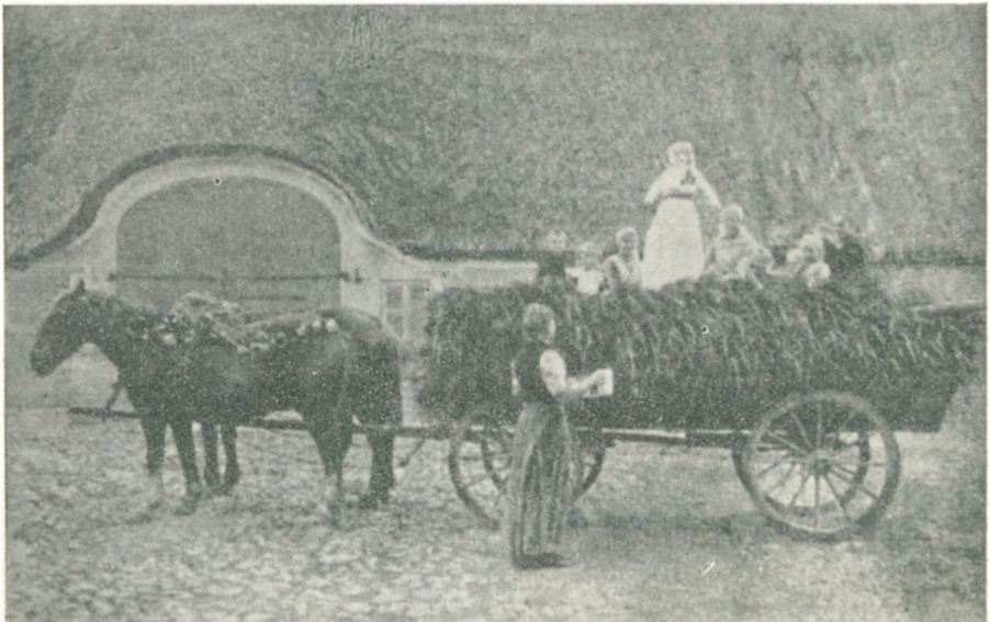
Det sidste Læs, »Basse« eller »Fiskjærv« køres hjem paa Barsø. Kai Uldall fot. — (Efter Danmarks Folkeminder Nr. 32.)

I »Frederiksborg Amts Avis« 7/9 1935 hedder det: »I Barsmark er der allerede mange Gaarde, der er færdig med Høsten nu og har haft det saakaldte »Bassegilde«, en Benævnelse for Høstgilde, der kun [efter »Hejmdal«s Mening] findes paa Løjt Land. »Æ Basse« er en udstoppet Dukke, der sættes paa det sidste Læs Korn, der køres hjem fra Marken. Dette Læs køres smykket med Blomster gennem Landsbyen, medens de, der sidder paa Vog-