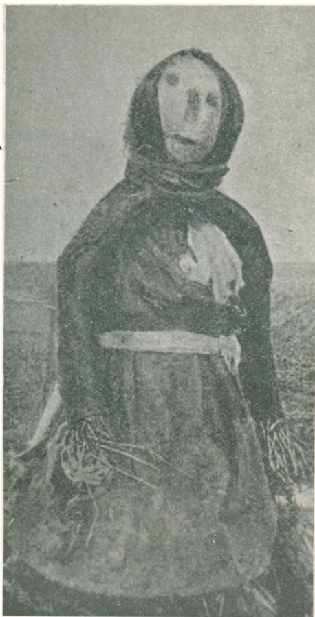
»Høstpige« fra Salling. Svarer til »Fissemænd« i Nordslesvig.

Det sidste Læs, der køres ind, kaldes her i Løjt »e Basse«. Et Neg udpyntes nemlig som Høstpige og stilles op paa Læsset for at køres med hjem. Det er egentlig denne Figur, som kaldes »e Basse«, og hvorefter Læsset benævnes. Hestene udpyntes med Blomster, og Læsset, som kun maa være lille, for at Høstfolkene og især Børnene kan være med paa samme, plejer man at køre gennem Byen eller i det mindste gennem en Del af denne. Det udstafferede Neg (e Basse) opbevares ofte til Høstgildet, for at Høstfolkene kunde danse omkring det. Høstgildet (Høsthøtte) forløber nu lidt mere roligt som i ældre Tider. Det er i den senere Tid bleven en ret almindelig Skik, at Folkene paa den Dag, det sidste Læs køres ind, faar en bedre Middag og om Aftenen vartes op med Kaffe og Kage samt Punch til at slutte af med. Der drikkes Skaaler, og der bliver ogsaa danset. Kun dem, som har deltaget i Høstarbejdet, indbydes til denne Festlighed. (Forøvrigt se