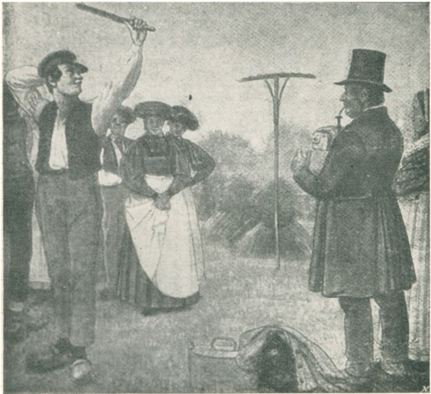
Strygekastning fra Sønderjylland omkring 1850. (Efter Danm. Folkem. Nr. 6.)

En Nutidsoptegner, K. Kristensen, Grønninghoved, meddeler 1926, at det tidligere ogsaa her har været Skik (sml. S. 222), at det Par, som høstede og bandt det sidste Neg, var dem, der blev kaldt for »Fi'sfar« og »Fi'smor«, men ved Ophøstningen af det sidste Stykke kunde der jo nok laves lidt Kunder. For hvis der nu var Kig paa et bestemt Hold til at bære Spottenavnet, kunde de andre jo nok gaa noget efter det ved at tage enten bredere eller