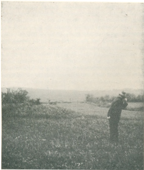
Den korrekte Stilling ved Strygekastning. — Fra Haderslevvegnen. (Sml. S. 216.)