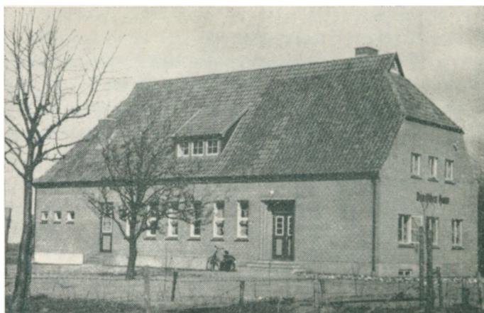
Tysk Forsamlingshus («Deutsches Haus») i Jyndeved.