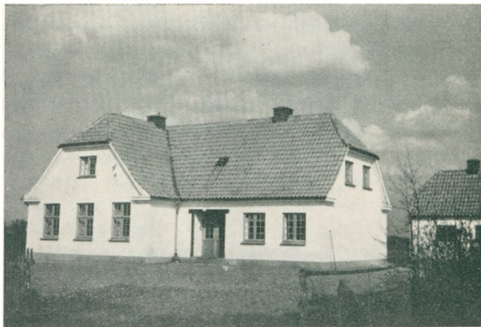
Dansk Forsamlingshus i Jyndeved.