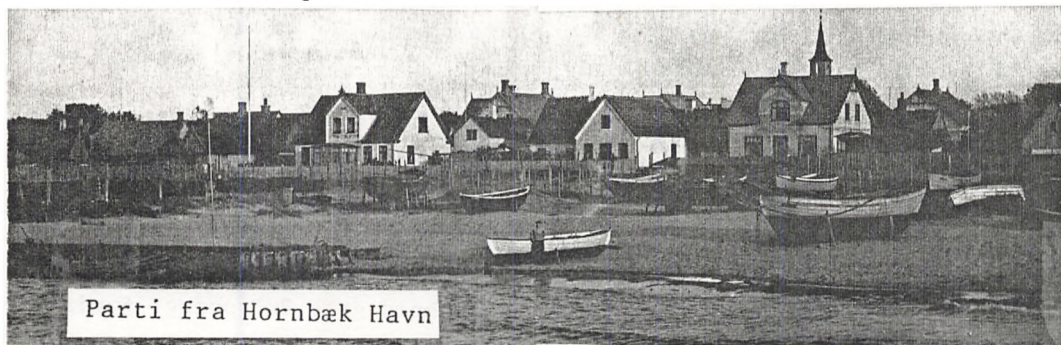
Parti fra Hornbæk Havn

med hver Klud beslaaet. Ganske enkelte Fartøjer forsøge at krydse frem, hvilket synes at være haabløst, da Strømmen er imod. Langs Kysten ses dog en halv Snes Stykker, som med smaa Slag krydse frem; paa de smukke Fartøjer og den flotte Manøvrering ses det snart, at det er Fiskekuttere; naar de komme i Nærheden af Havnen kaste de Anker og kun Forsejlene hales ned; thi saa snart Fiskeredskaberne ere bragte iland for at tørres og efterterses, løftes atter Ankeret og Maalet er Helsingør eller Kjøbenhavn, hvor Fangsten, som for Nogle har været god, for Andre kun ringe, skal afsættes.