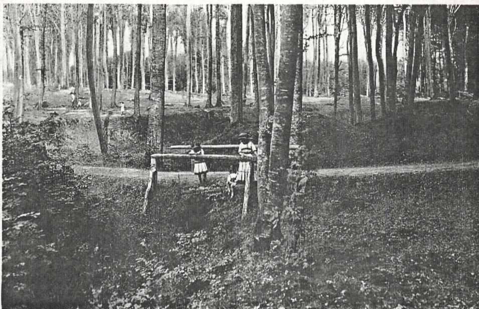
Skovparti ved Espergærde.

som Aar efter Aar kommer tilbage og derved har indlevet sig saaledes med Befolkningen, at de gjensidig daarligt kunne undvære hinanden. Det er et godt, ja, man kan gjerne sige hjærteligt Forhold, som har bevirket, at de faste Beboere efterhaanden have tilegnet sig en vis Dannelse ved Københavnerne, ligesom man hos disse undertiden kan spore, at Omgangen med den naturlige og godmodige Fiskerbefolkning ikke er skadelig.