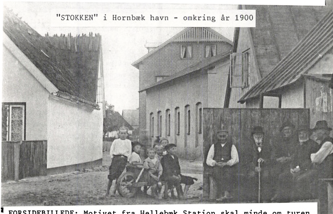
"STOKKEN" i Hornbæk havn - omkring år 1900

FORSIDEBILLEDE: Motivet fra Hellebæk Station skal minde om turen til Hammermøllen i Hellebæk, den 8. september.