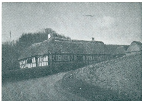
Det gamle Aabus ved Rosenvold Aa, 1922.