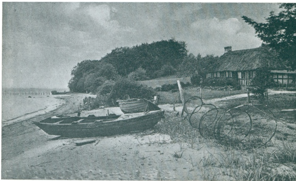
Løjtnanthuset ved Fakkegrav, ca. 1920.