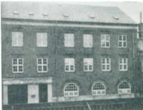
Worning & Petersens Sæbefabrik, Vejle.