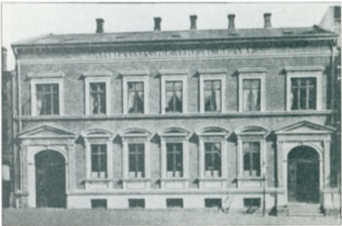
Sparekassen for Vejle By og Amt.

Foruden Vejle Bank findes der en Filial af Landmandsbanken i Vejle. Ogsaa den har været til Støtte for megen Handel og Industri i Vejle, og især under Krigen har den