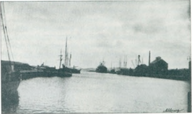
Udsigt over Vejle Havn.