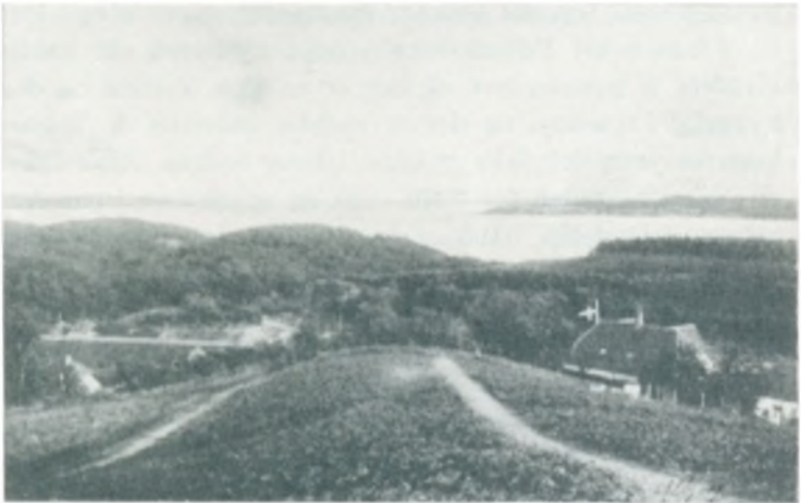
Fjordlandskab fra Vejle.