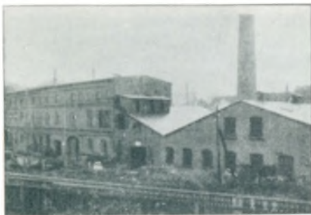
A/S Bjerregaards Sønners Fabrik.

I Grejsdalen findes Grejsdals Hammerværk, Firma Brødrene Brincher, hvis Spader kan ses i enhver Isenkramforretning. Denne Virksomhed holder til Foraaret 50-Aars Jubilæum. Inde i Vejle har den sat Frugt i en