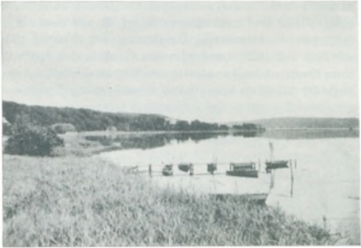
Fra Vejle Fjord.