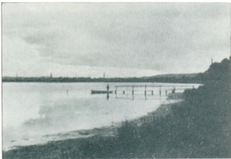
Ved Vejle Fjord. I Baggrunden ses Vejle By.