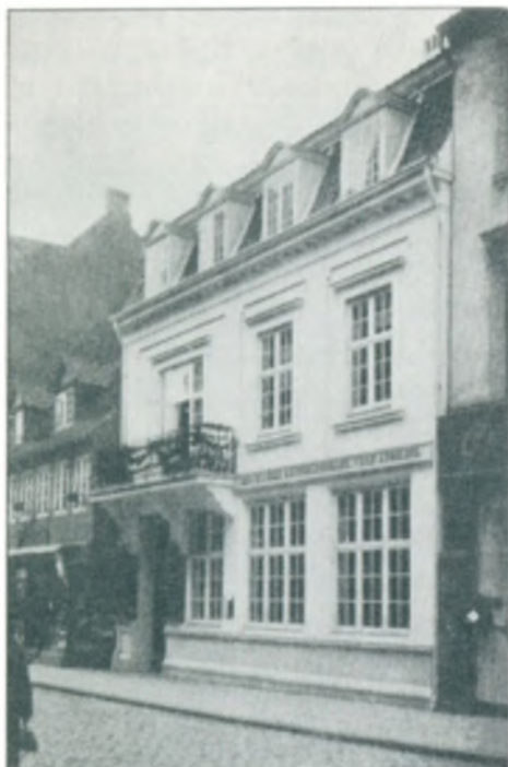
Den danske Landmandsbank, Vejle.

Til uvurderlig Nytte for Handelen og Industrien i Vejle har Vejle Bank været. Det er et af de største Pengeinstituter her i Landet, og det er bleven det, fordi det er bleven ledet med stort Fremsyn. Mange Forretninger, der nu