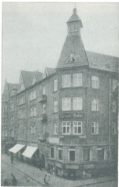
Grand Hotel, Vejle.

Og som Slutsten paa denne hurtige Razzia gennem Vejles Næringsliv skal vi erindre Formanden for Byens