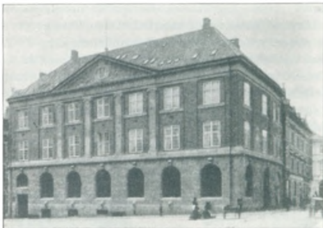
Vejle Banks Bygning.