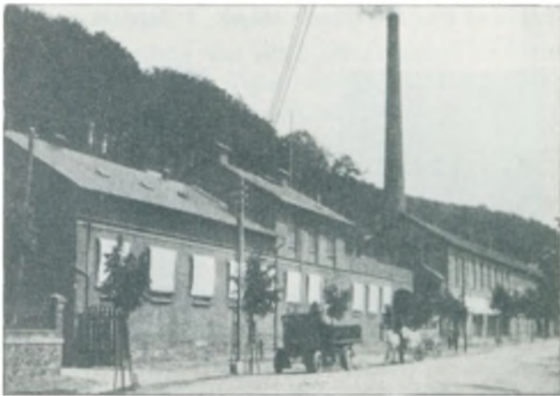
A/S H. Steensens Margarinefabrik.