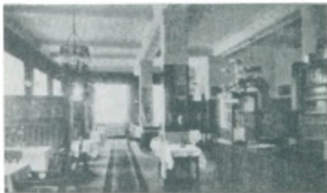
Grand Hotels Spisesal.

Til de smukkeste Punkter i Vejle Fjord fører regelmæssig Baadfart, og Turisterne vil overalt finde gode Hoteller og Restauranter. I selve Byen findes en Række fortrinlige Hoteller, det gamle fine »Royal« ved Siden af