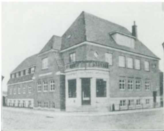
M. Jørgensens Frøhandel.

anden Forretning i denne Branche har opnaaet herhjemme. Mange pragtfulde Blomsterdekorationer er i de forløbne Aar udgaaet fra Eglys Forretning, og der foreligger talrige begejstrede Anbefalinger og Udtalelser fra Autoriteter for smukt udførte Arbejder; men den fornemste af dem alle er en Anerkendelsesskrivelse fra det kejserlige russiske Hof. Vilh. Egly byder ofte Vejlenserne paa interessante Seværdigheder i smukke Udstillinger, bl. a. i Haandværkerforeningens Sal, af Aarstidens smuk-