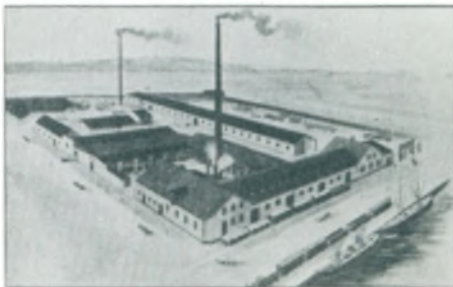
De danske Blodfoderfabrikker i Vejle.