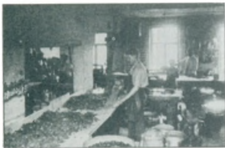
Interiør fra Vejle Sukkervarefabrik.

Vejlenserne søge hans smagfulde Lokaler, hvor en Del af Fodtøjet stammede fra hans egen Fabrik. — Fabrikant Bundgaard Andersen driver en ganske betydelig Forretning under Navnet