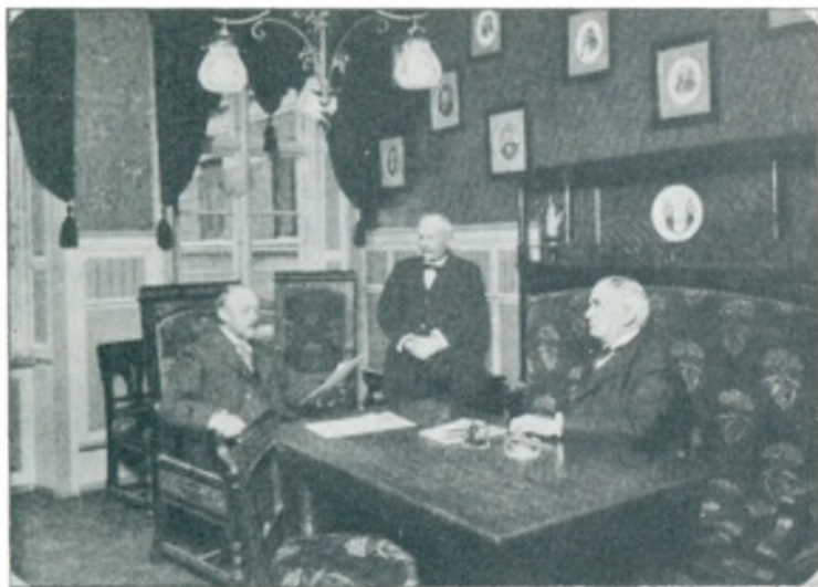
Direktionsmøde i Sparekassen.

— En Skildring af Vejle Bys Handel og Industri vil nødvendigvis forme sig til en Skildring ogsaa af Vejle Bys Mænd. Hvad Vejle har af Navne, findes næsten helt og holdent indenfor de to Grupper. Nogle flere