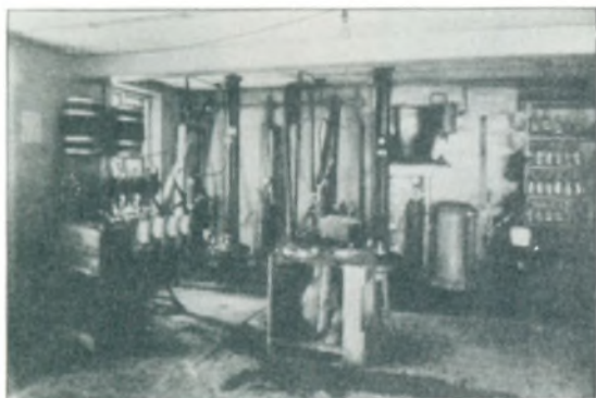
Interiør fra Vejle ny Mineralvandsfabrik.

M. Jørgensens Frøhandel og Planteskole i Grejsdalen er et af Landets største paa sit Omraade. Firmaet grundlagdes i 1884 under ret beskedne Forhold og rummede til at begynde med alle Fagets forskellige Grene indenfor sine Rammer, men efterhaanden blev Frøhandelen og Planteskolen Firmaets Hovedvirksomhed, og Forretningens enorme Vækst paa dette Omraade krævede stadig nye Udvidelser og Tilbygninger. Firmaets smukke, illustrerede og beskrivende Kataloger vidner om, at Forret-