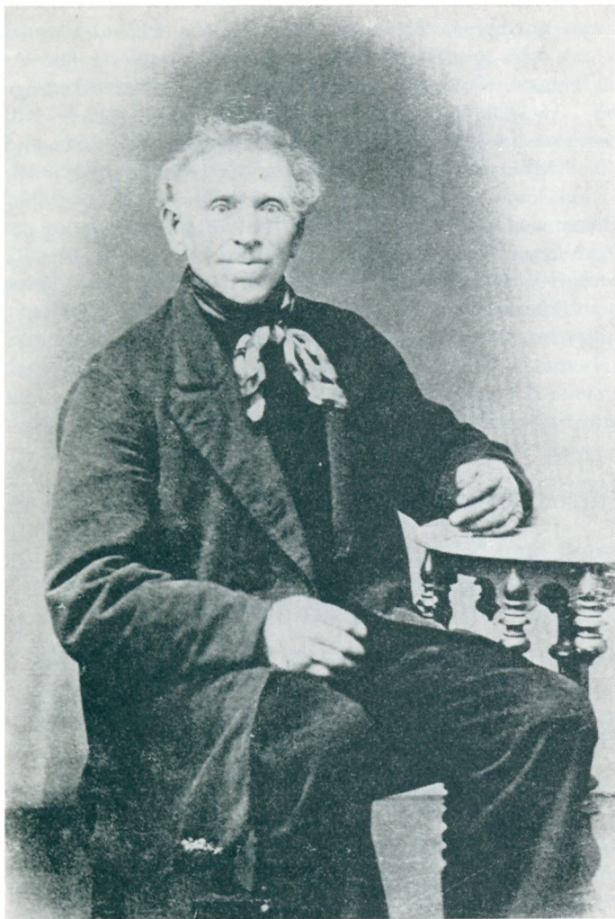
Stamfaderen Niels Bendtsen (1808–1891).