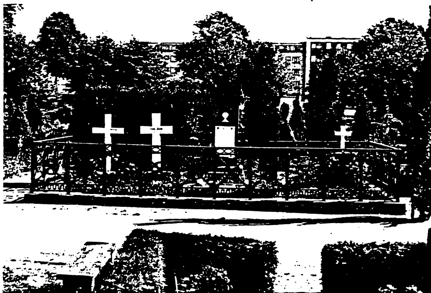
Ålborg Almenkirkegård /nyt nr. 9 / 1. rk. / grav nr. 13-16.