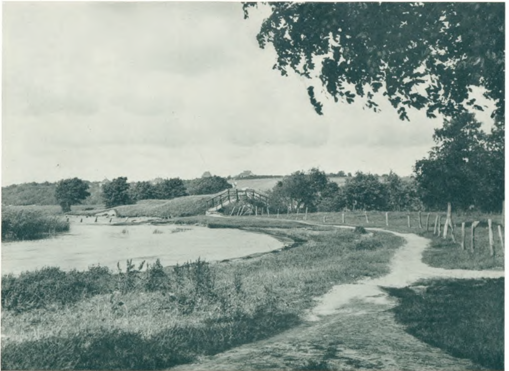
Hjortholm ved Furesøen