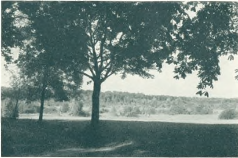
Udsigt over Mosen ved Kanningaarden