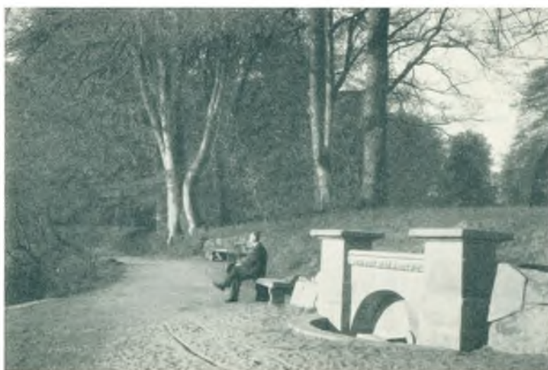
Partier fra Sorgenfri Park