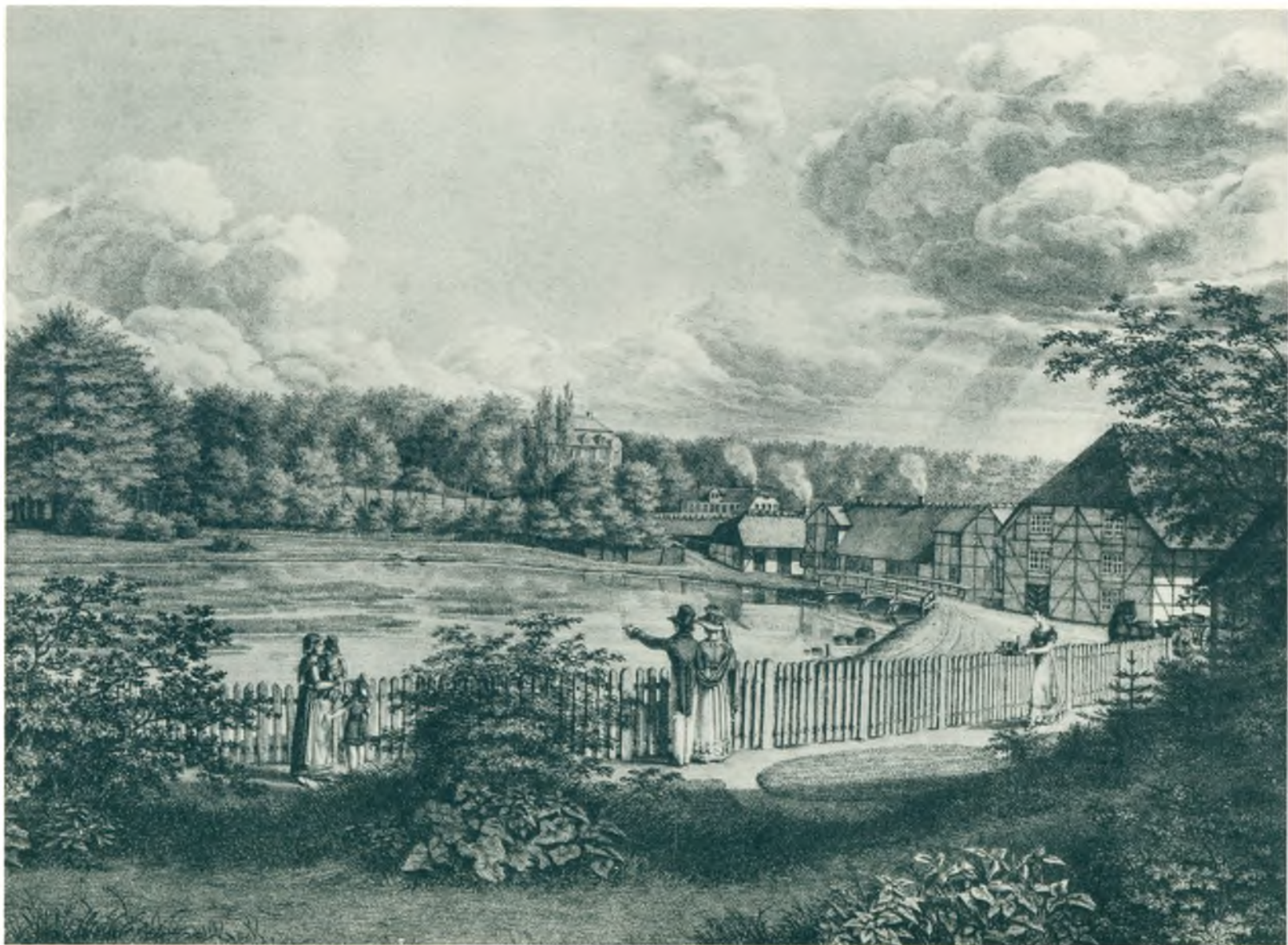
Frederiksdal ca. 1820