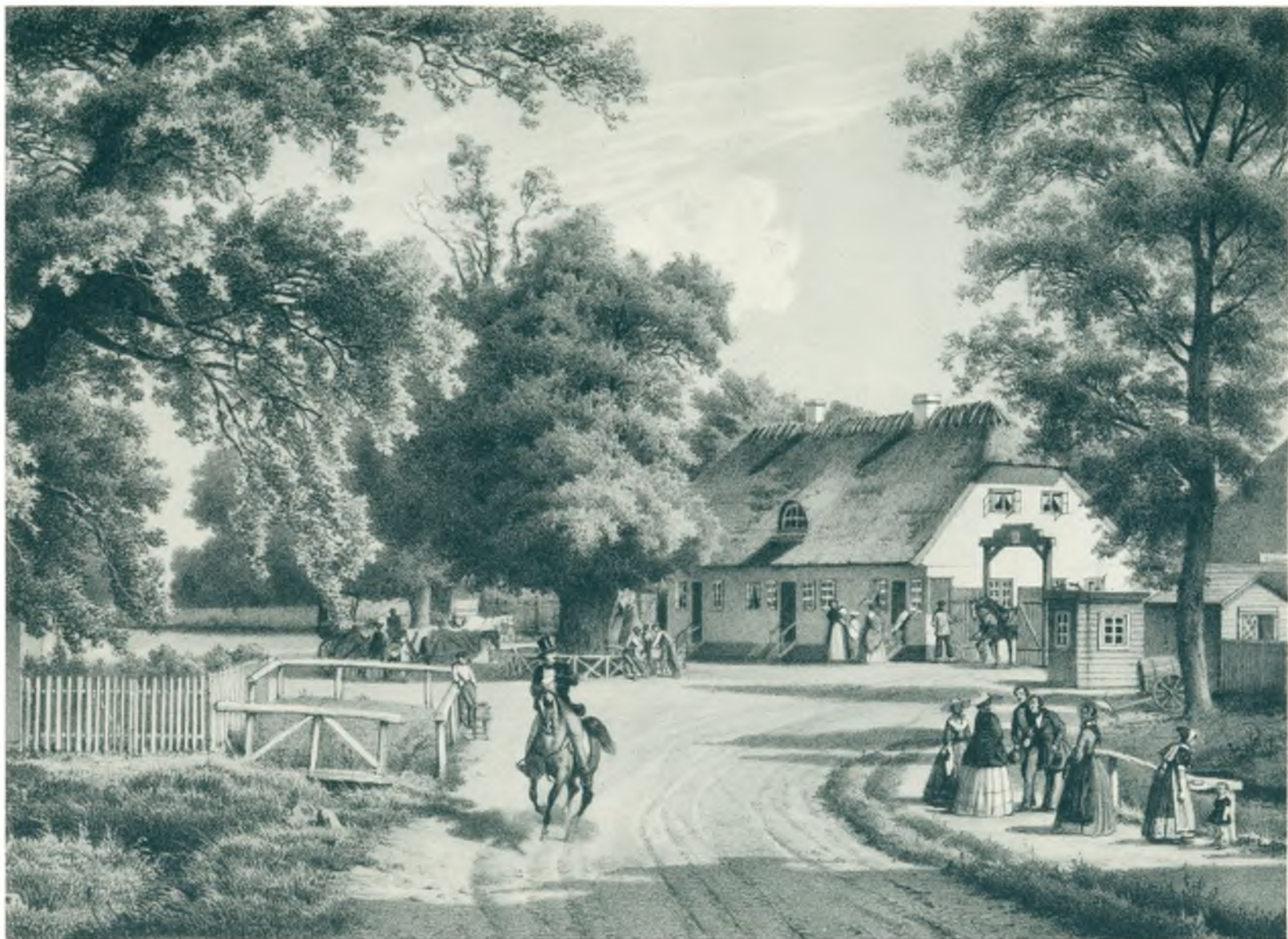
Klampenborg ca. 1870