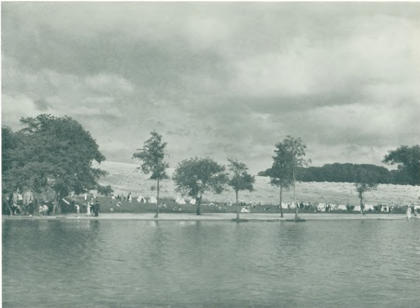
Fribadet ved Frederiksdal