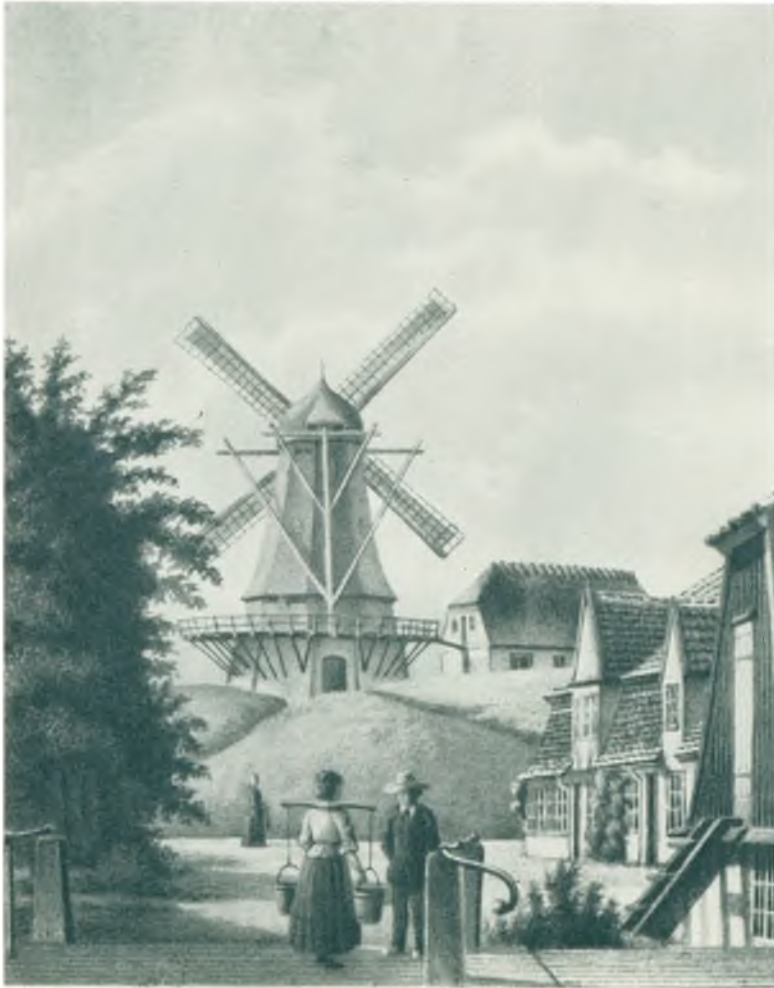
Fuglevad Mølle ca. 1865