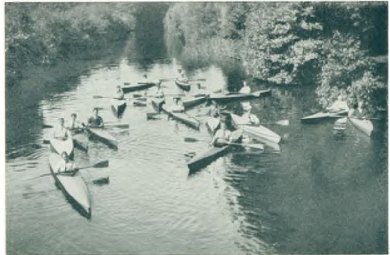
Fra Kanalen ved Frederiksdal