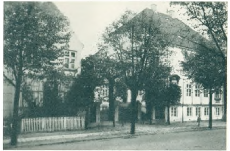
Palæet. Lyngby Hovedgade