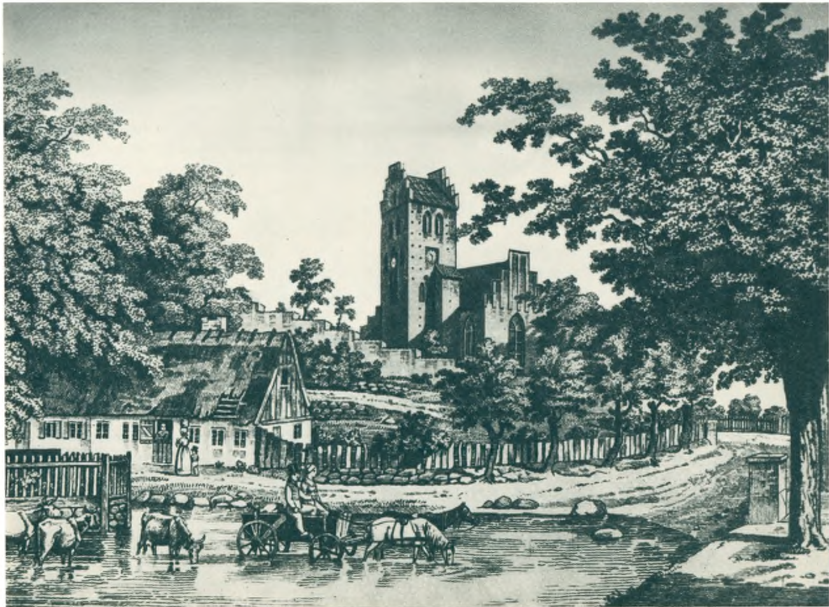
Lyngby Kirke med den gamle Branddam 1826