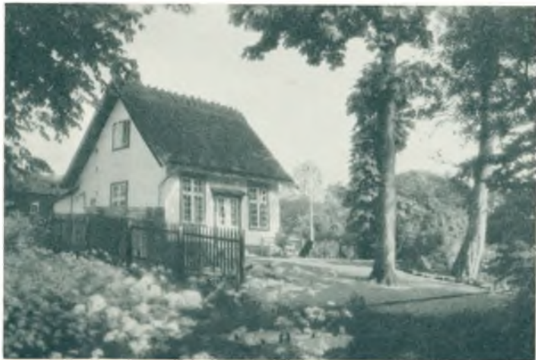
Musikhuset (Lille Schallsborg)