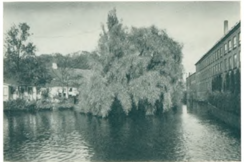
Branddammen med Øen ved Hotel Lyngby