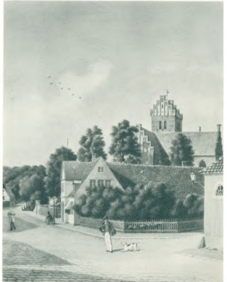
Lyngby Hovedgade 1878