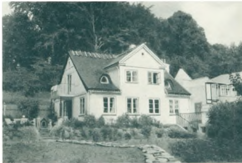
Fuglsang ved Prinsessestien