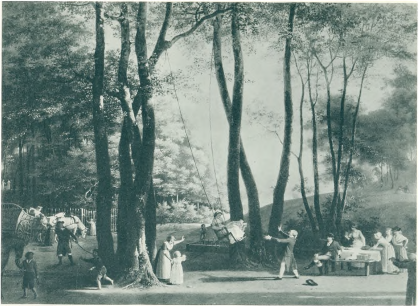
Dansebakken ved Lottenborg ca. 1790