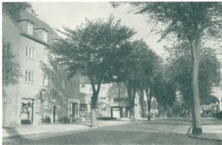
Den sydlige Del af Hovedgaden