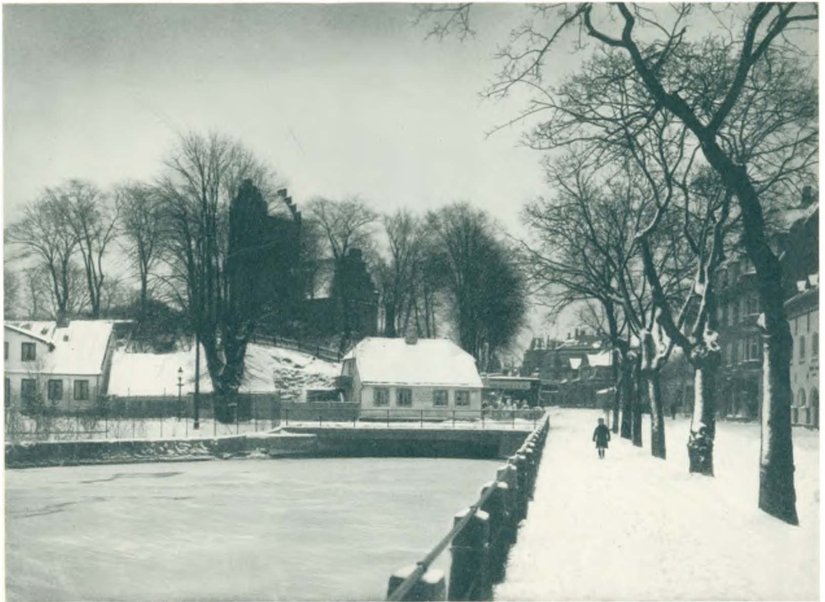
Byaa og Kirke