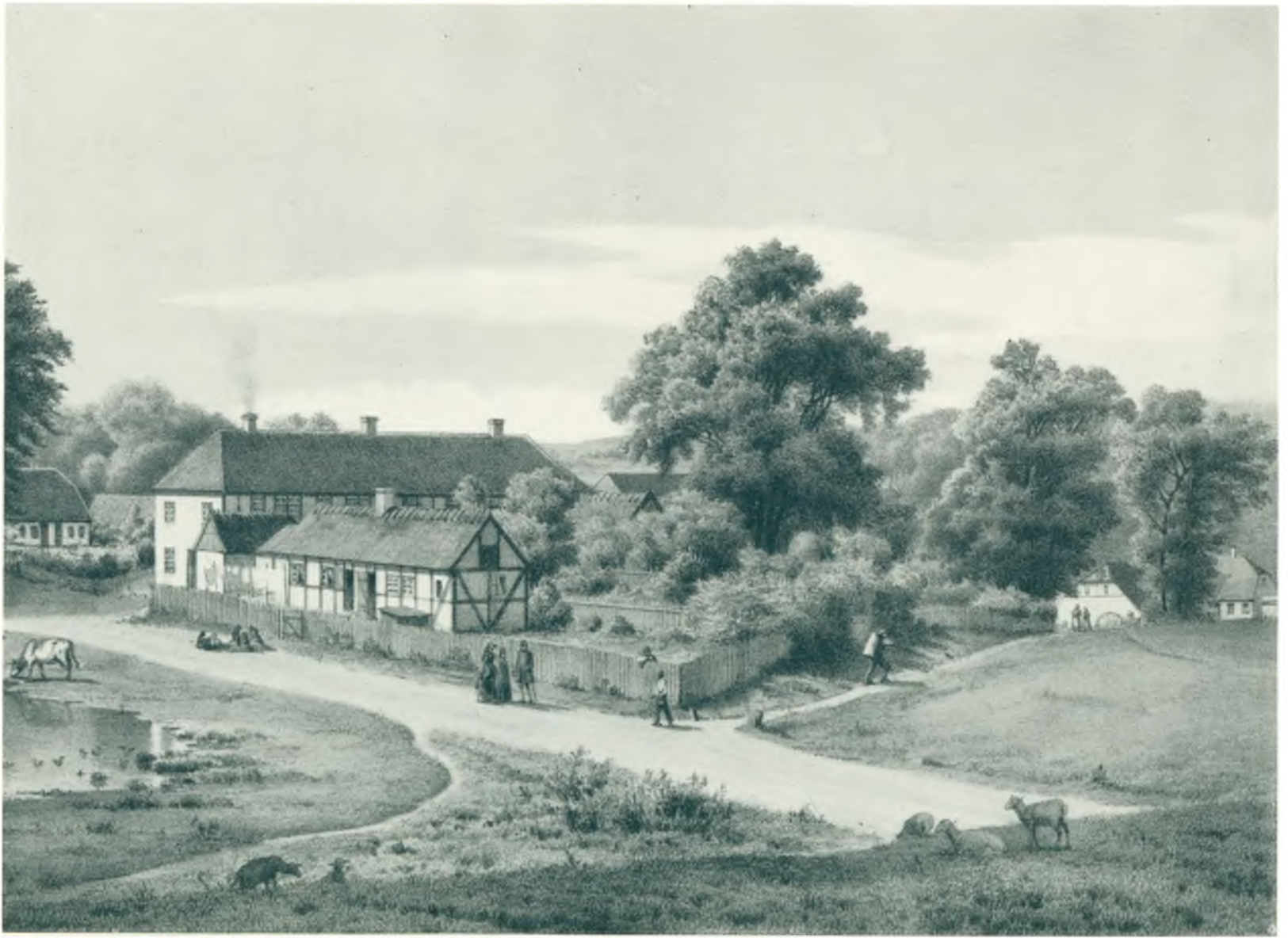
Raadvad ca. 1860