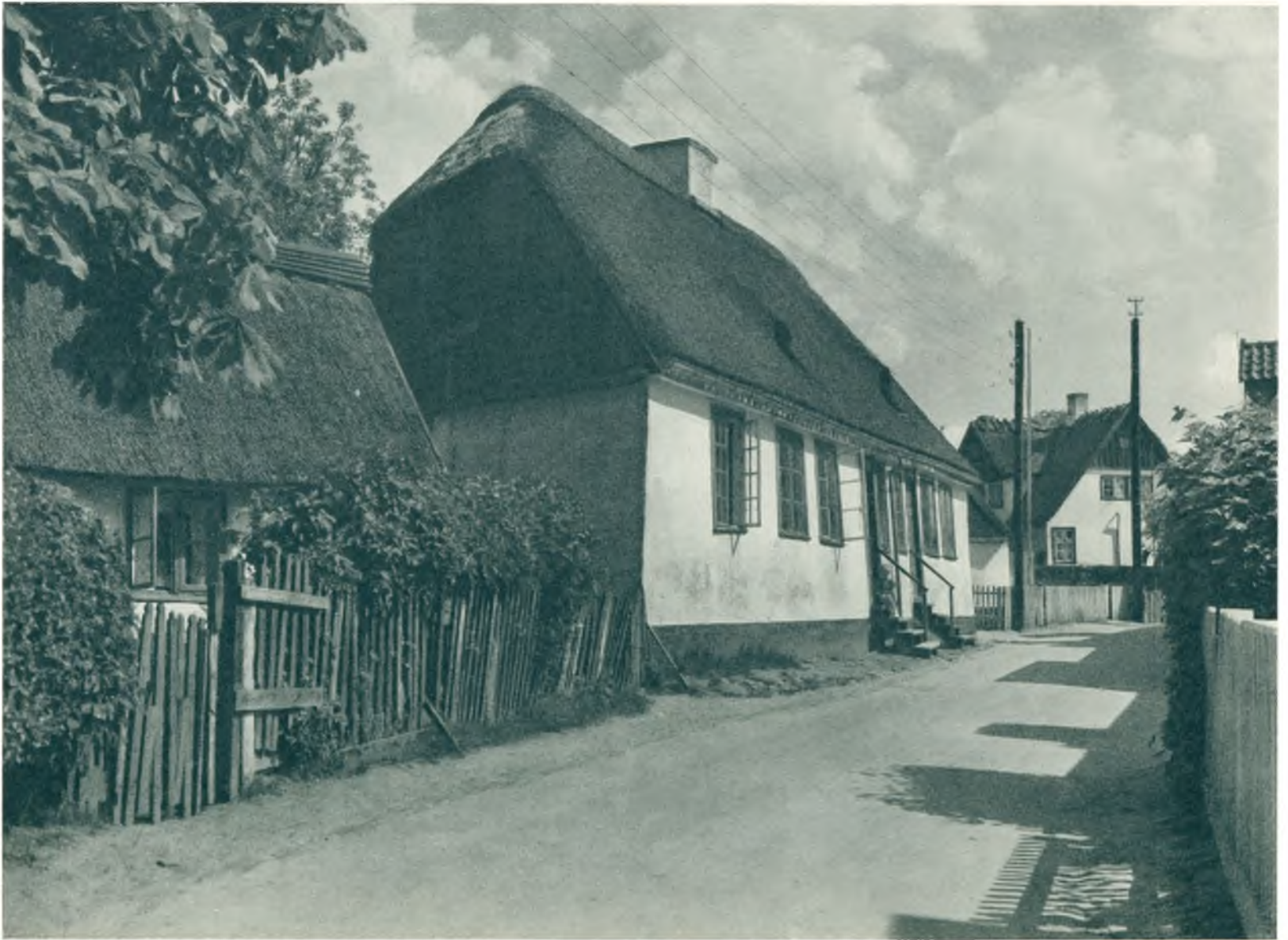
Gamle Huse i Bondebyen