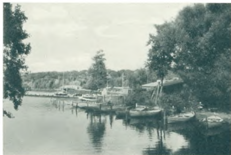
Fra Lyngby Sø