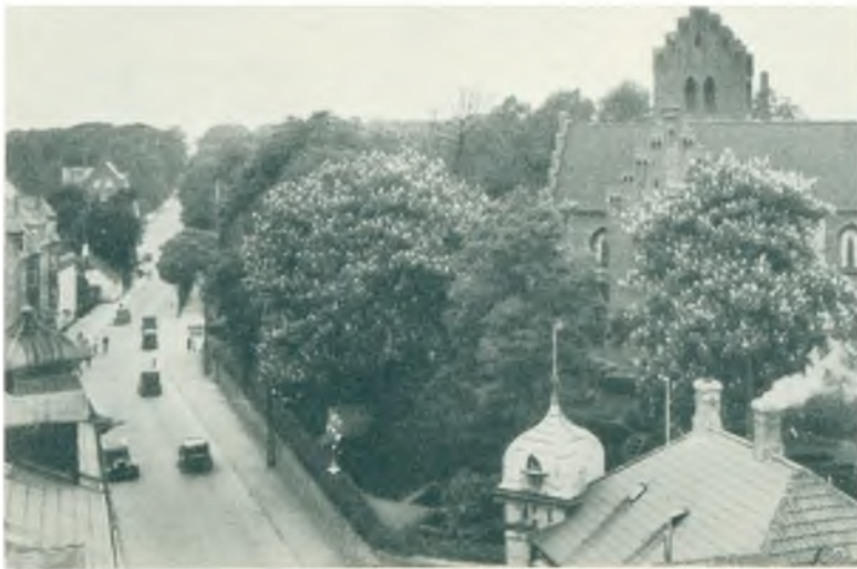
Parti fra Hovedgaden