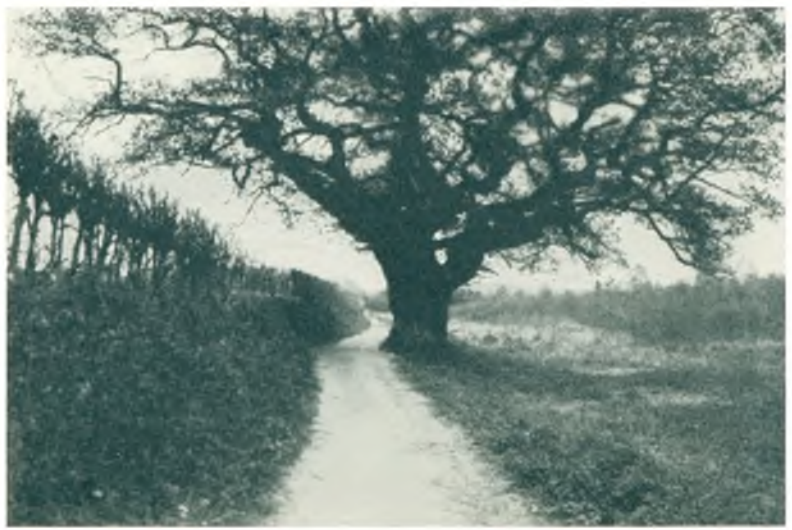
Monrads Eg. Prinsessestien