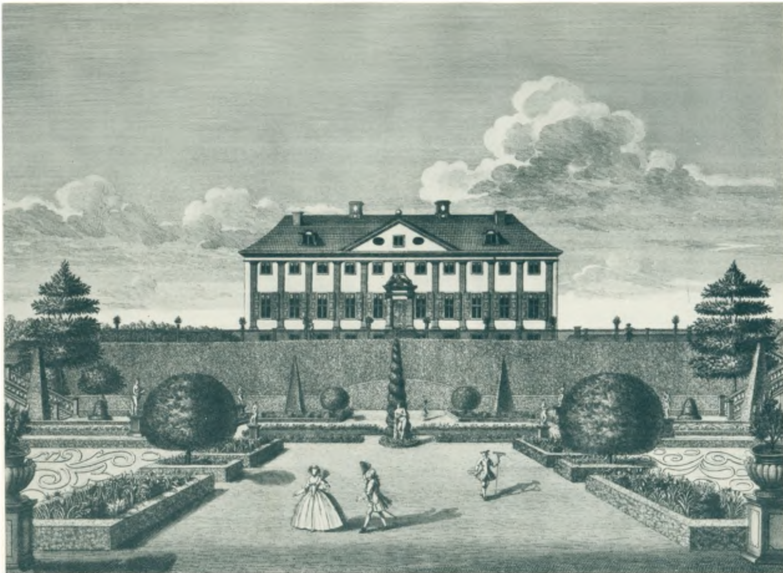
Sorgenfri Slot 1705