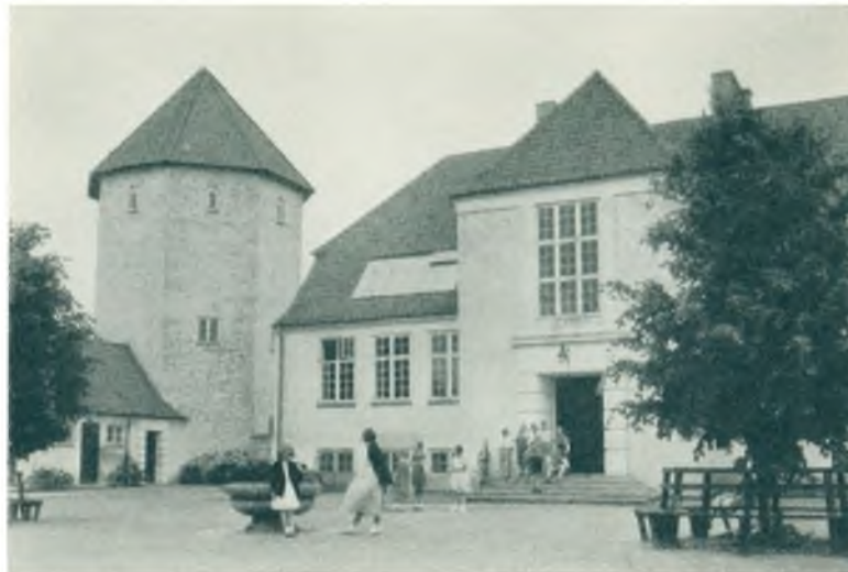
Virum Skole og Vandtaarn