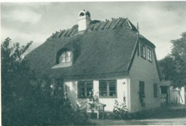
Gammelt Hus i Virum