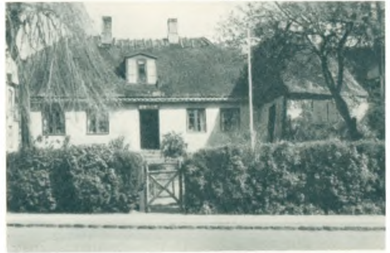
Gammelt Hus i Aastræde