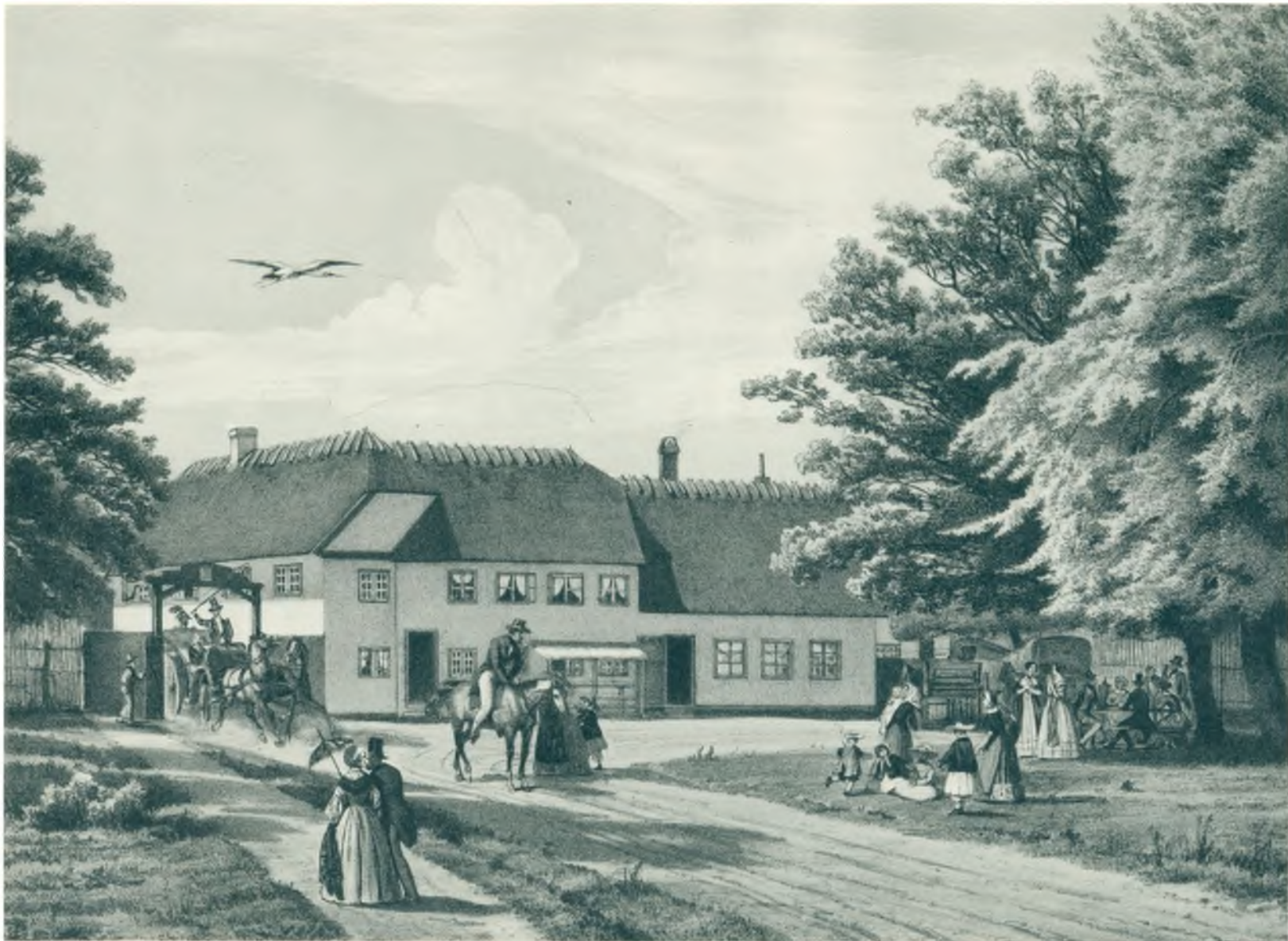
Fortunen ca. 1830