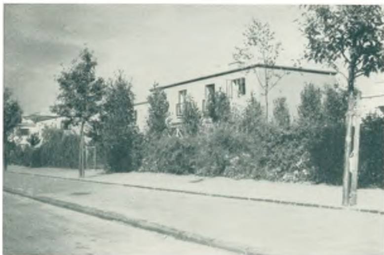
Fra den engelske Haveby