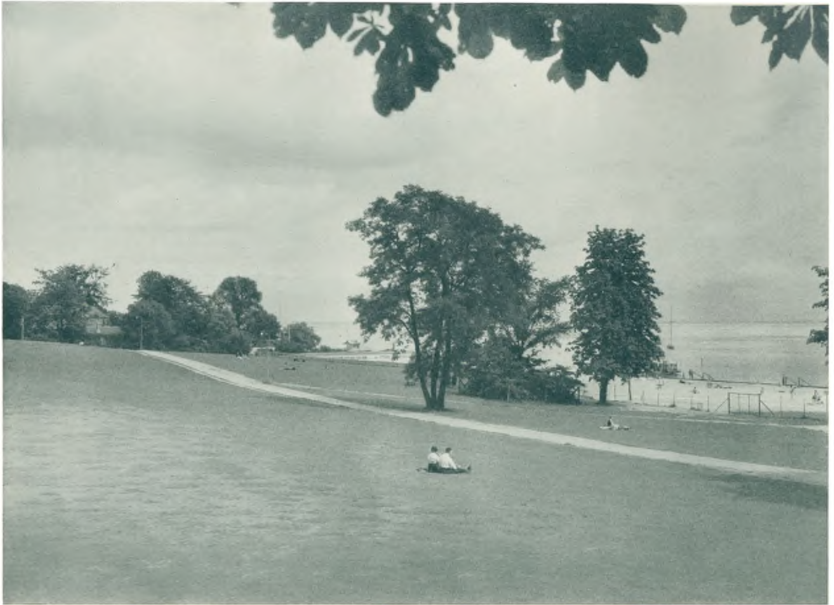
Strandparken ved Klampenborg