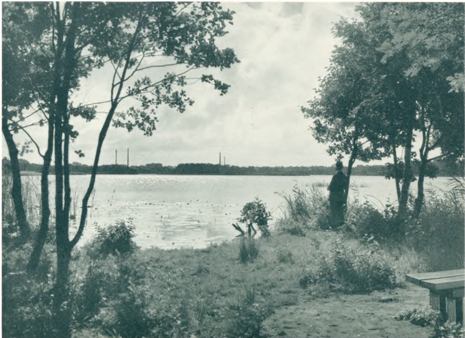
Udsigt over Lyngby Sø fra Mosen ved Prinsessestien