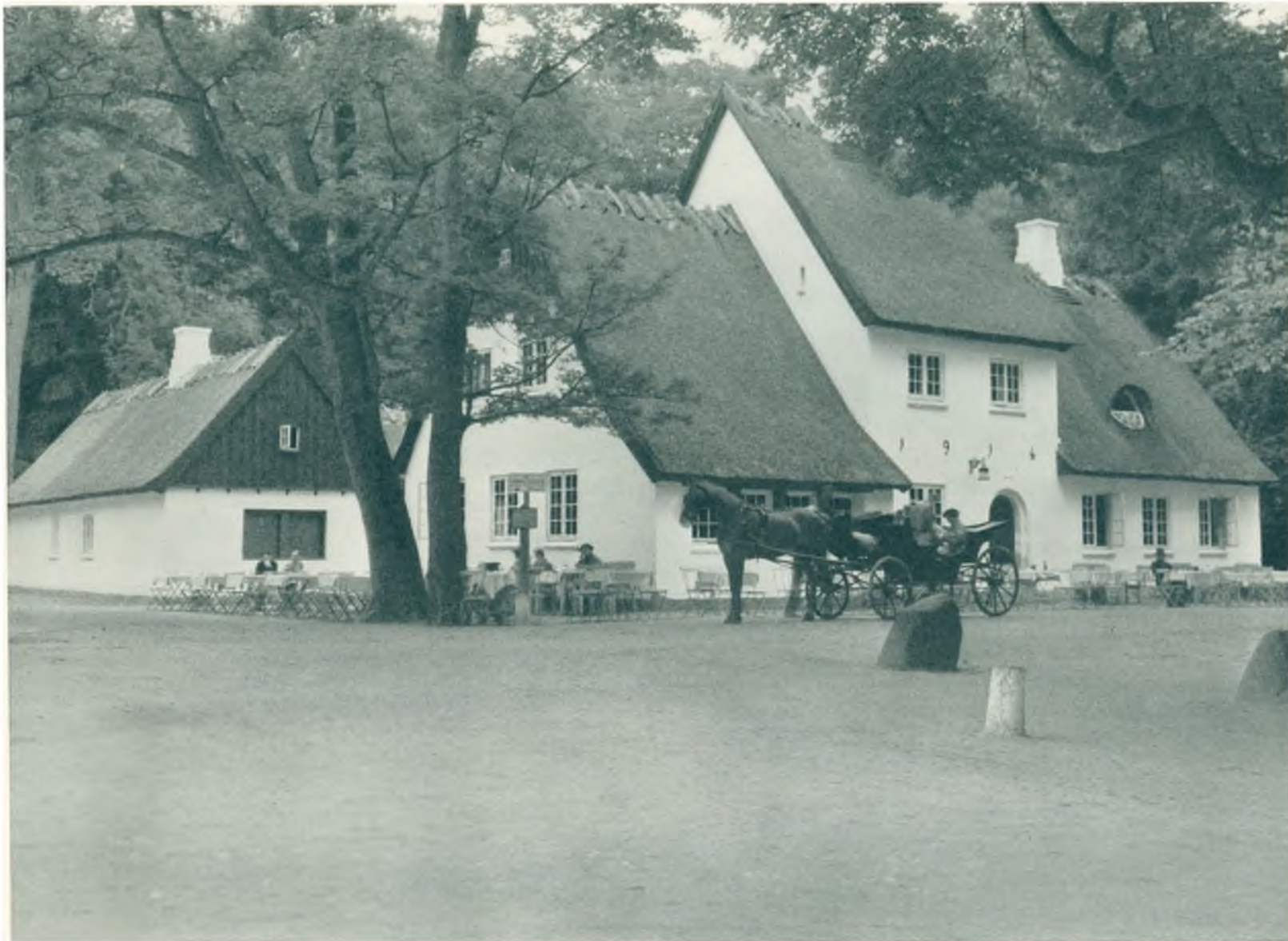
Peter Lips Hus i Dyrehaven