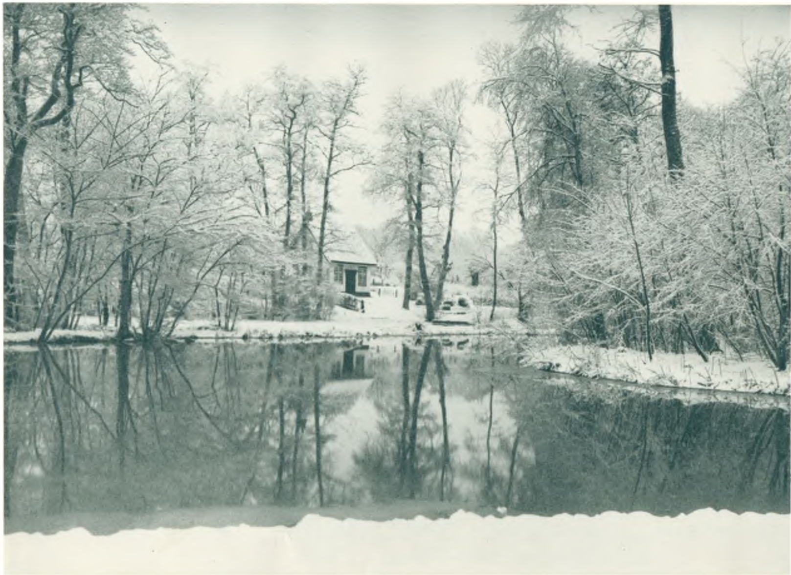
Musikhuset set fra Sorgenfri Park