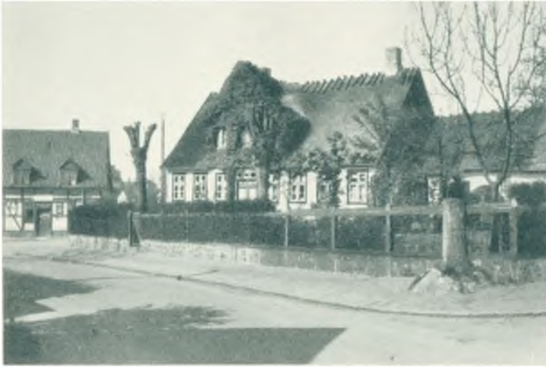
„Støvlet-Katrines Hus“ i Bondebyen