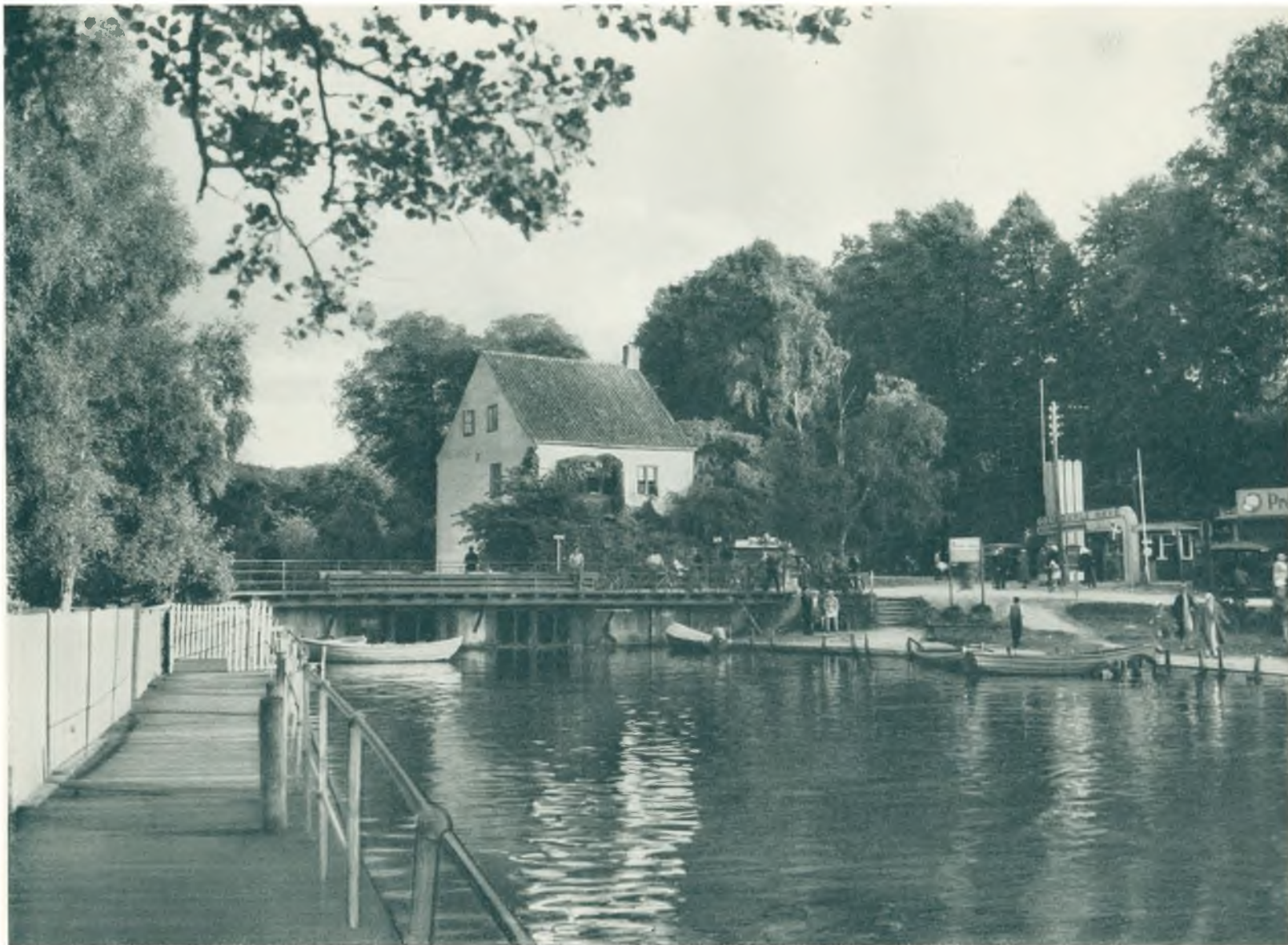
Strømhuset ved Frederiksdal