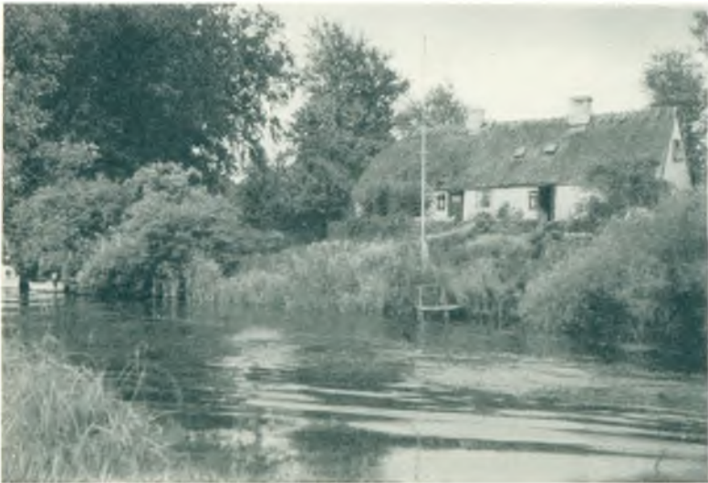
Kanalen ved Frederiksdal