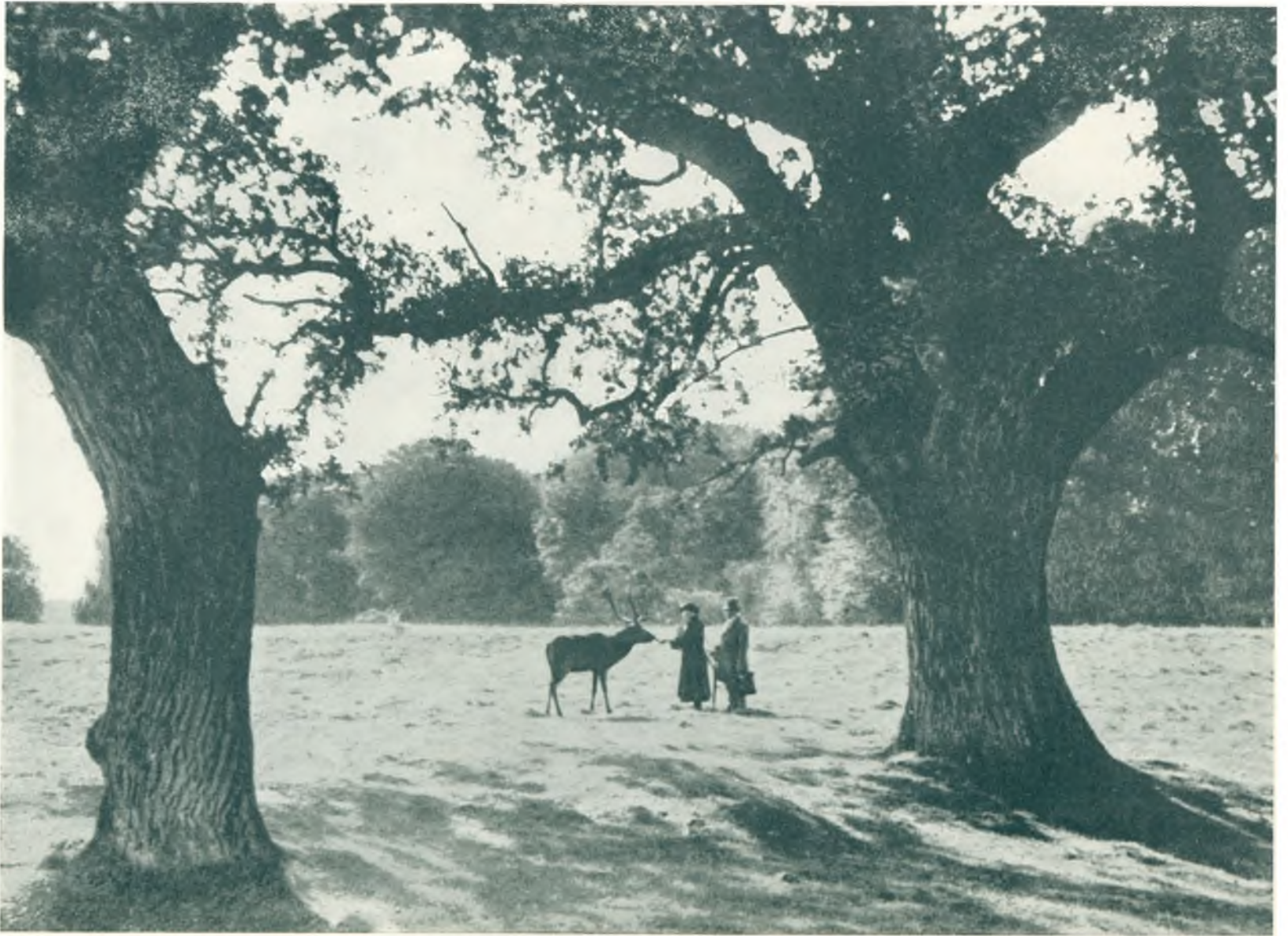
Parti fra Dyrehaven