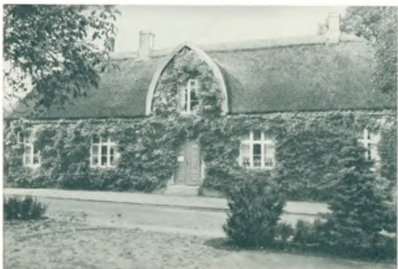
Gl. Gartnerbolig ved Rustenborg