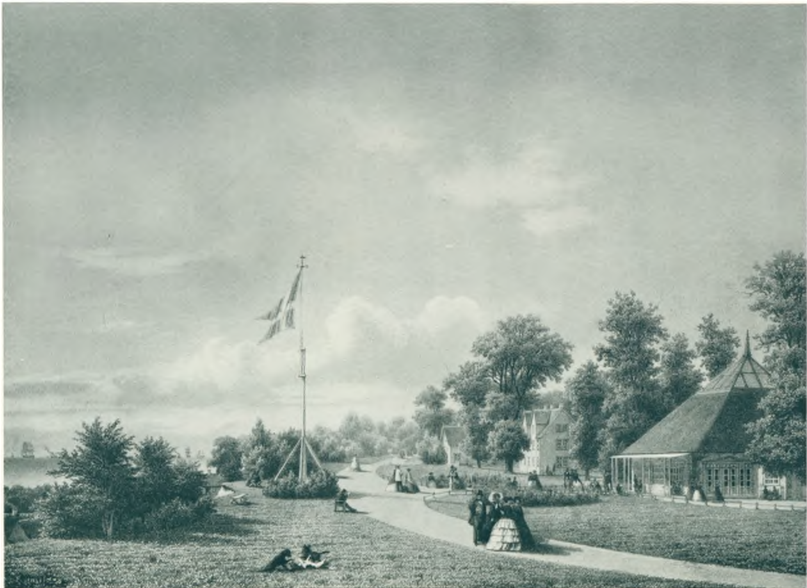
Klampenborg Kurbad ca. 1850