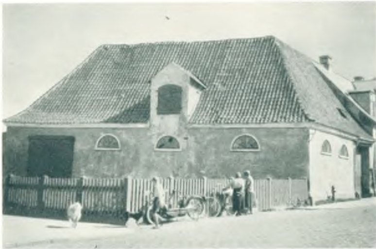
Holland's gamle Rejsestald