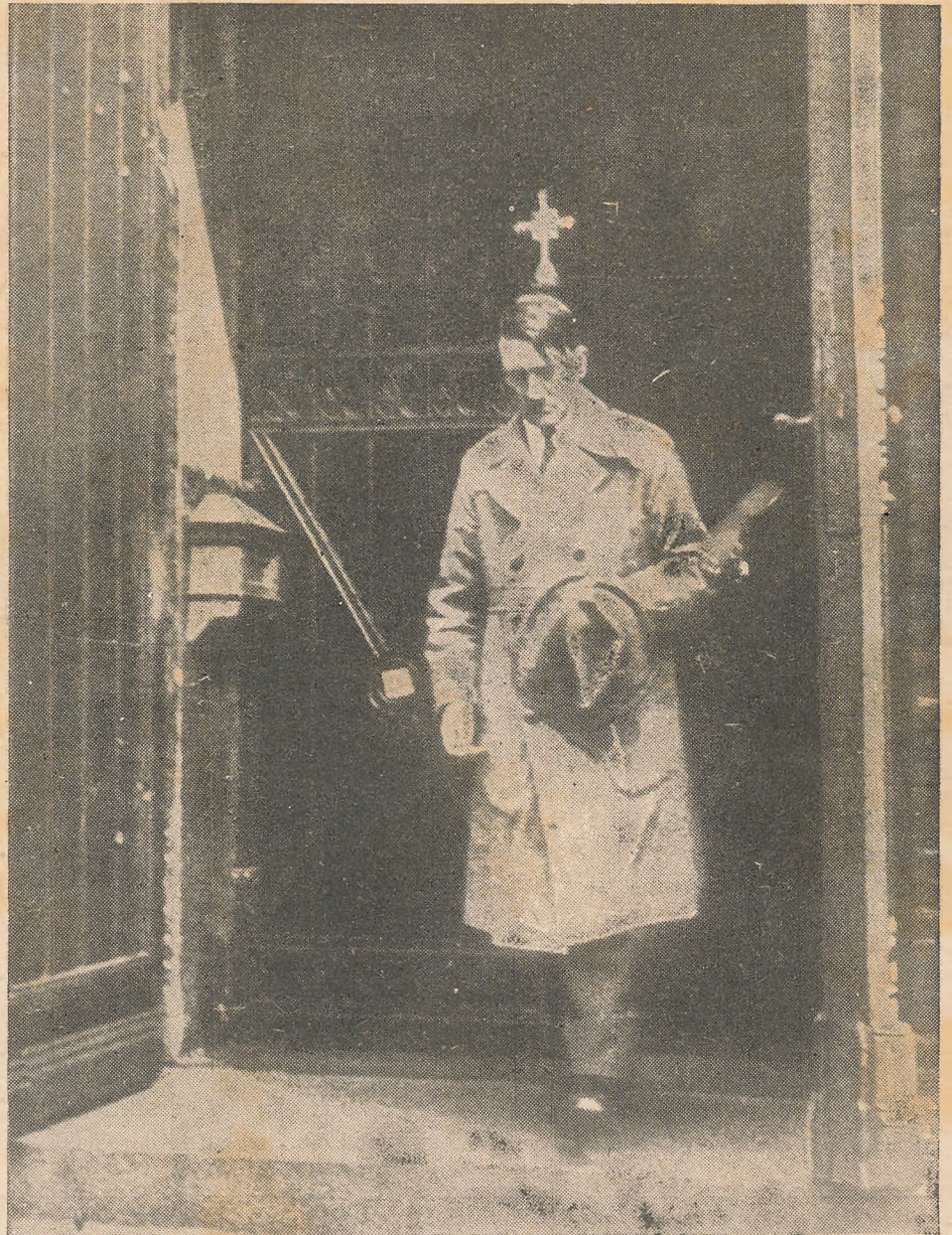
Ovenstaaende Billede stammer fra et nazistisk Billedværk »Hitler wie ihn keiner kennt«, udgivet i 1931. Billedet er i Bogen forsynet med Teksten: »Eine photographische Zufälligkeit wird zum Symbol. Adolf Hitler, der angebliche »Ketzler«, beim verlassen der Marinekirche in Wilhelmshafen.« Det lysende Kors straalte over den guddommelige Hitlers Isse!

De enkelte Etapper i den Kirkekamp, der fulgte, vil jeg ikke komme ind paa her. At Nazisterne indenfor deres egne Rækker ikke kunde blive enige om det Tredie Riges eneste saliggørende Kirke, gav den kirkelige Opposition Vind i Sejlene. Der opstod nemlig ikke mindre end 19 forskellige nazistiske Religionsgrupper, som dog var indbyrdes enige i Tilbedelsen af det ariske Menneske, ligesom de alle ansaa det for nødvendigt at den kristne Lære blev rensat for alt jødisk Islæt. Forherligelsen af et barbarisk Livssyn skulde erstatte Humanitet, Moral og Etik. Nogle af Grupperne bestræbte sig for at bevare Kristendommens Maske, medens andre helt aabent vedkendte sig Hedenskabet, og atter andre sank ned paa et rent patologisk Niveau som