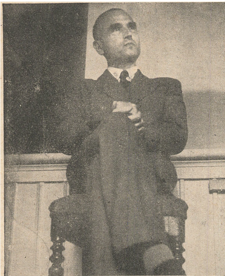
Best: — Jeg har erkendt, at disse Mennesker for enhver Pris har tilstræbt at føre Danmark ind i de allieredes Rækker — et Mål, som de jo paa straalende Maade har naaet.