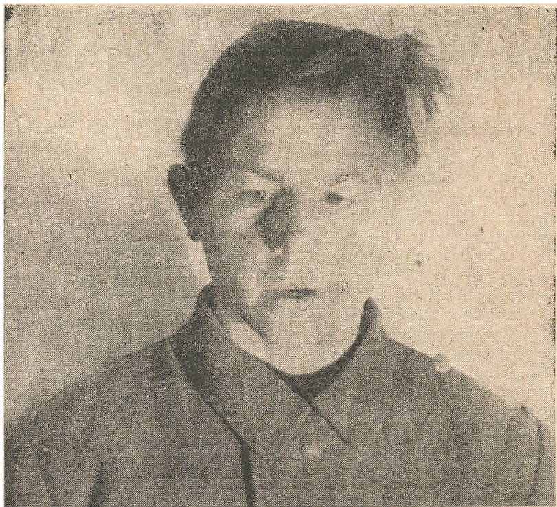
Et smukt Fysiognomi: En dansk SS-Mand fra Vagtbataillon Sjælland i Ringsted.