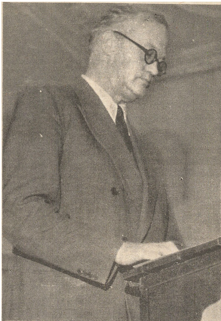
Sigurd Hoel fotografert i København i November 1945.

Han har en dejlig direkte Maade at skrive paa. Det er som om, han og Læ-