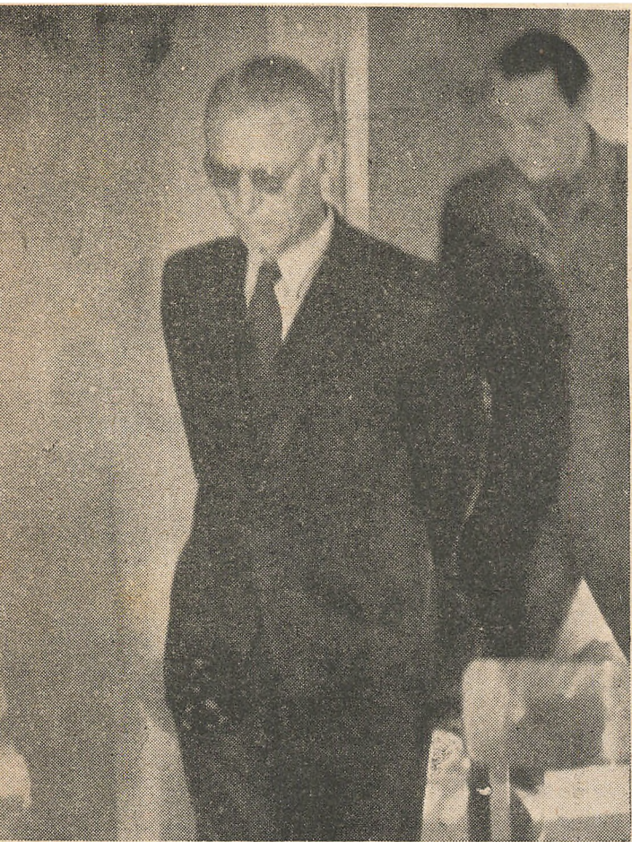
— Jeg har saa midt som muligt gennemført en Befaling, der blev givet mig af den højeste Personlighed i mit Folk.