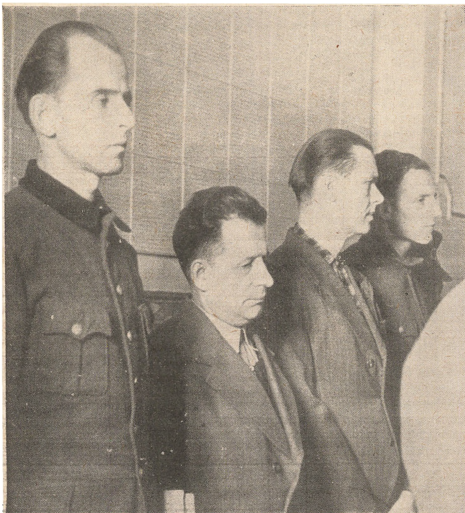
Typiske Landsforrædere for Retten i Norge.

I Norge antog Kampen mod Tyskerne meget hurtigt skarpe Former. Det var derfor ikke muligt i Norge som her at støtte og bistaa Besættelsesmagten saalænge det saa ud til, Tyskerne skulde vinde, og derefter slaa om og blive pletfri Demokrat og Dansker. I Norge var man Quisling eller ogsaa var man det ikke. Dette forklarer det norske Retsopgørs større Skarphed i Sammenligning med det danske.