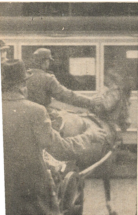
Et af de talrige hold-ups ved højlys Dag er blevet filmet i alle Detailler. En tysk Soldat befris for sine Vaaben af danske Patrioter. Det foregaar paa Amagerbrogade i Foraaret 1945.