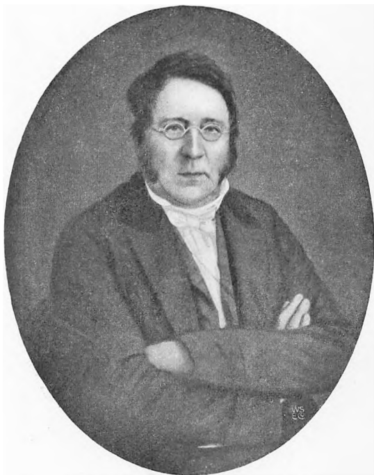
PROVST PEDER PAVELS AABEL