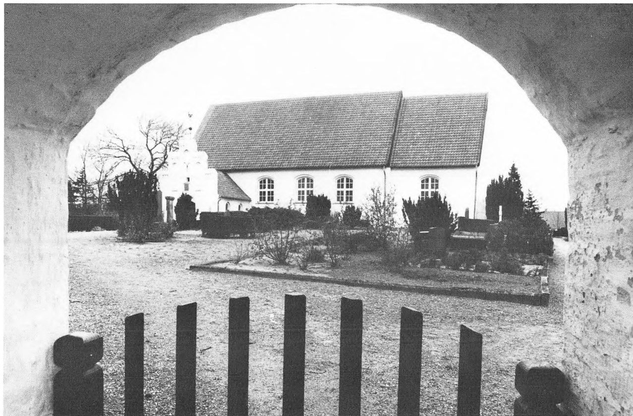
Rinkenæs gamle kirke, der var rammen om præstestriden.