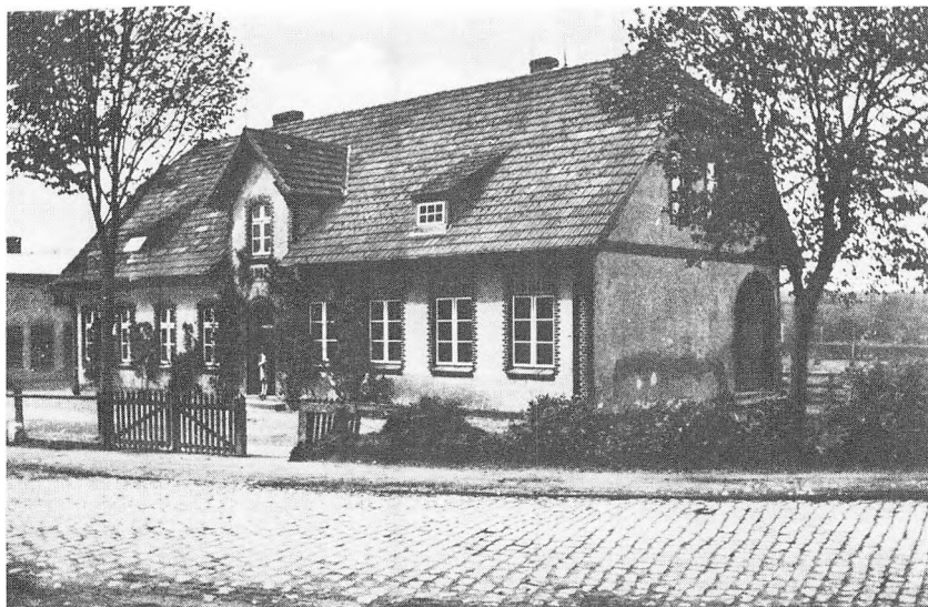
Skolen i Adsbøl. Opført 1903. Billedet er fra ca. 1920.

31. december var her stærkt højevande. Vandet gik helt op til kirkegårdsdiget, men her i Adsbøl har vandet ikke anrettet skader.