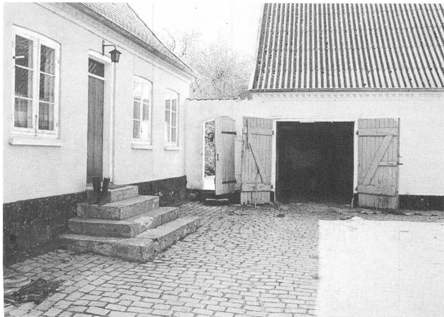
Vildstengård i Vejlenbrød set fra gårdspladsen. Også et eksempel på forstørrelse fra kontaktarket med optagelser fra

Vejlenbrød. Foto: Jens Thøger Christensen, maj 1980.