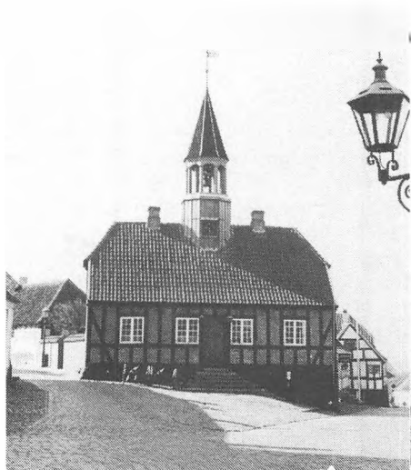
Det gamle Rådhus i Ebeltoft, nu museum. Her taget en solskinsdag. Til højre: Slupmandskabet og mødedeltagerne på vej fra Det gamle Rådhus til fregatten »Jylland«.