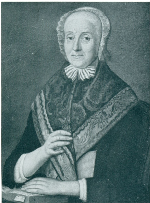
HELENE ELISABETH PRÆTORIUS 1715–1801