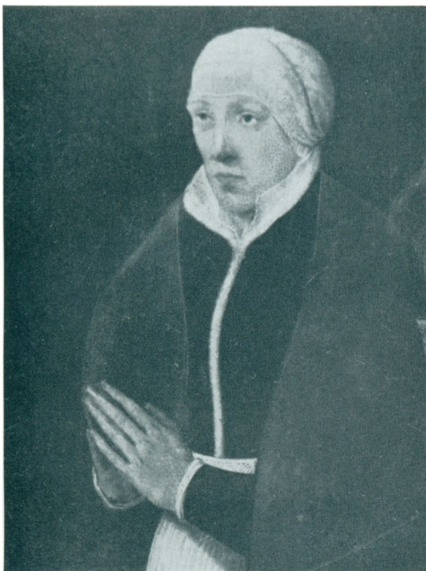
METTE CHRISTJÆRNSDATTER død 1551