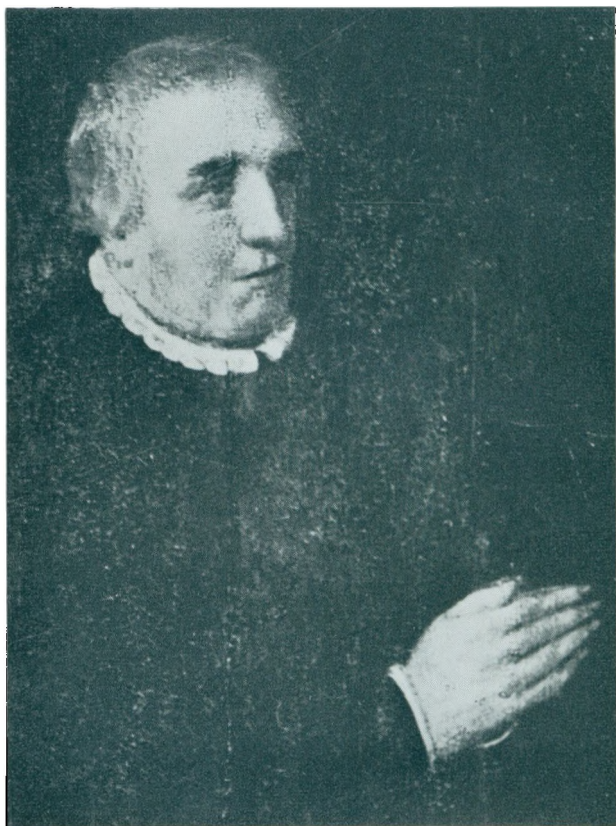
LAUGE STEFFENSEN Raadmand i Ribe død 1551