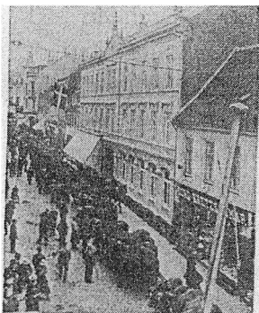
Torvegade på en markedsdag. Den store bygning er Hotel Randers. Ejeren, som er til højre, har bevilliget gade til heste for Det. Markedsdag - gæstgæverbrødet.

Torvegade på en markedsdag, hvor ovennævnte episode har fundet sted.