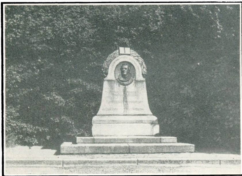
Mørk-Hansen-Stenen paa Skamlingsbanke.

„Jeg kan idag fortælle Dem en glædelig Nyhed fra Felsted, som har vakt megen Glæde hos hele Omegnens dansksindede Befolkning. Som de vistnok min-