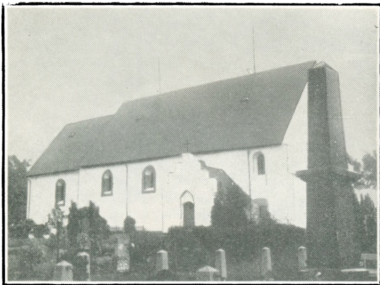
Felsted Kirke. (I Forgrunden Mindestenen over de Faldne i Verdenskrigen).