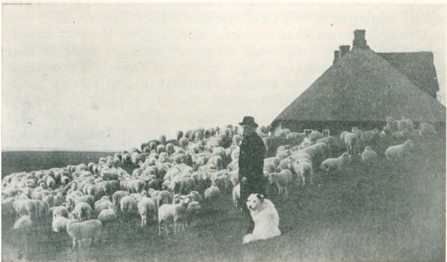
Faarehyrde paa Nordstrand