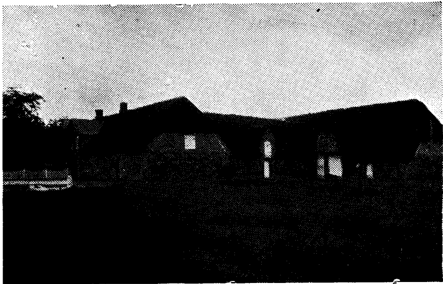
Diggrevens Gaard i Ballum.