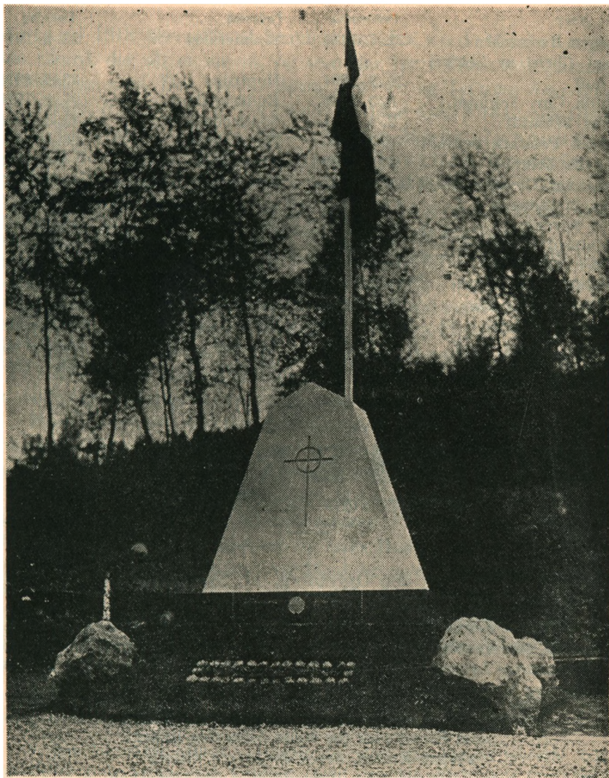
Mindesmærket paa Kirkegaarden.