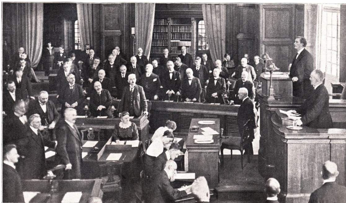
KLAUS BERNTSEN BYDER SOM FOLKETINGETS ALDERSFORMAND DE SØNDERJYDSKE REPRÆSENTANTER VELKOMMEN DEN 5. OKTOBER 1920