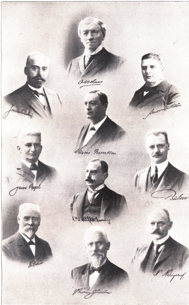
MINISTERIET KLAUS BERNTSEN 5. JULI 1910—12. JUNI 1913