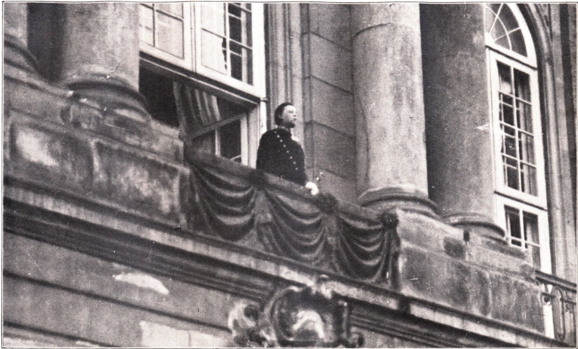
KLAUS BERNTSEN UDRAABER KONG CHRISTIAN X FRA AMALIENBORG 15. MAJ 1912