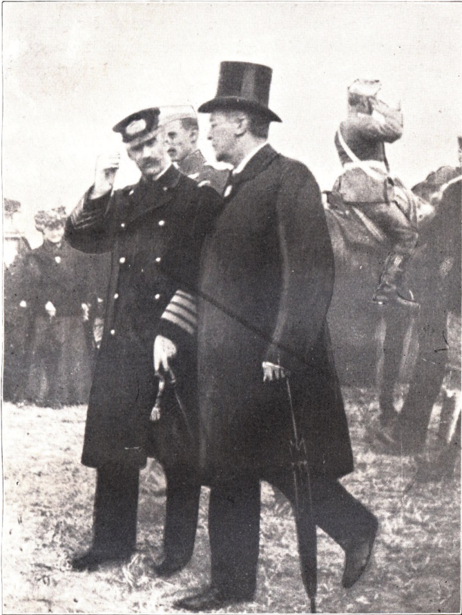
KONG FREDERIK VIII I SAMTALE MED KLAUS BERNTSEN (I BAGGRUNDEN SES KRONPRINS CHRISTIAN)