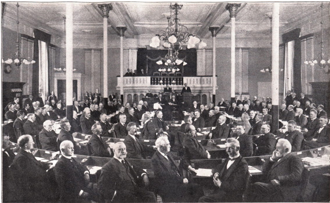
KLAUS BERNTSEN TALER VED GRUNDLOVENS ENDELIGE VEDTAGELSE DEN 5. JUNI 1915 I DEN GAMLE FOLKETINGSSAL I FREDERICIAGADE