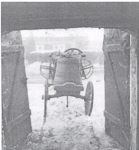
Den sidste gang Nyrup Brandsprøjte var til "ildebrand", var i 1944, da Nyrup-gaardens lade brændte. Her er den dog fotograferet i 1977.

Det eneste generende punkt er nu, at de, som har handlet med sprøjten og tjent penge på det, går fri - og at biludlejeren i Tulstrup ligefrem erklærer, at han skal have noget i bytte. Det må være meget vanskeligt åbenlyst at påstå, at man har været i god tro, når man har købt en hestetrukken brandsprøjte fra 1860'erne - sådanne køretøjer vimler det jo ikke ligefrem med!