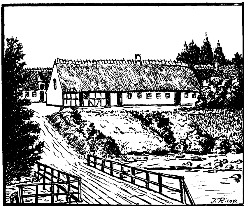
Det gamle hertugelige Kaal og Færgested i Høruphav, nedbr. 1903.