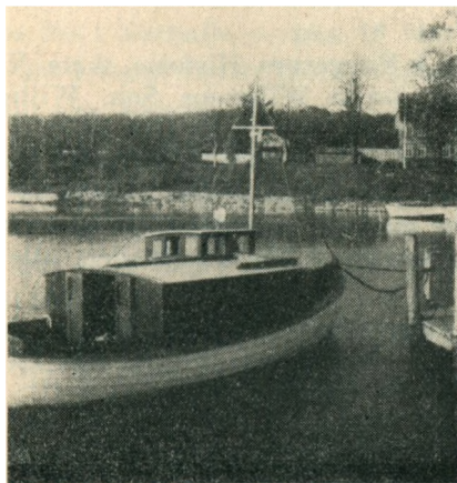
Færgebaud ved Høruphav, 1940.

I ældre Tider, da der ingen Færge var paa Kajnæssiden, maatte Folk, naar de vilde sættes over, tude i et Horn. Saaledes maatte det ogsaa gøres i Høruphav, naar Færgebaaden laa paa Kajnæssiden.