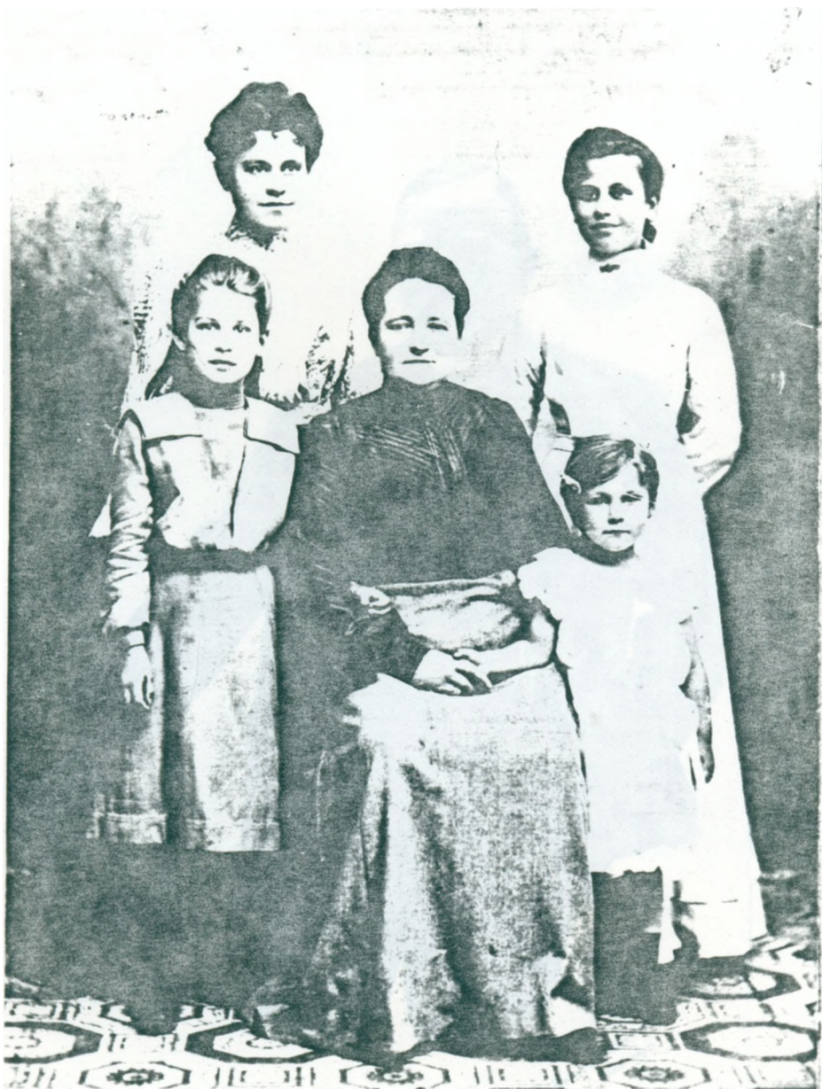
19. Farfars mormor