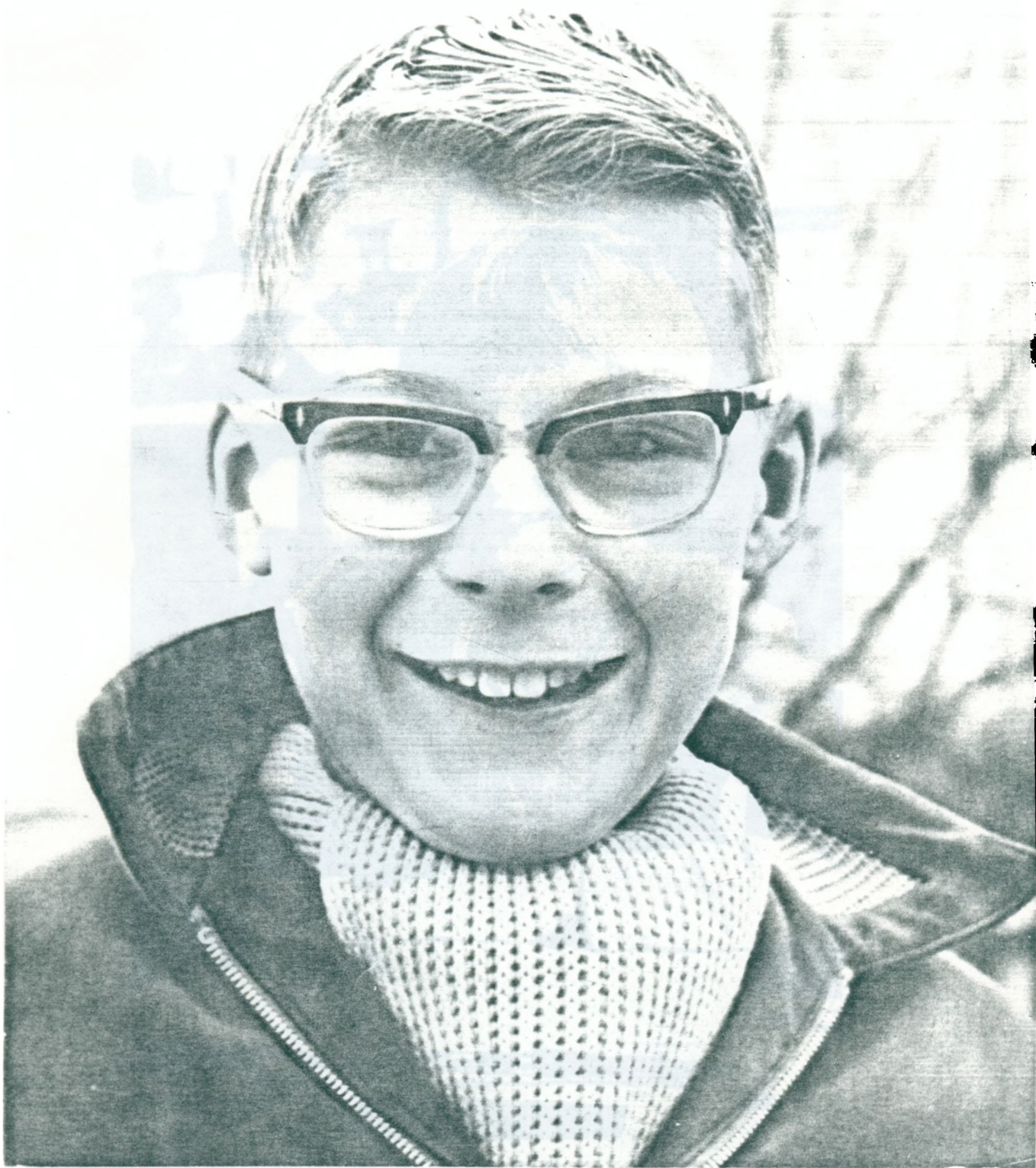
2. Jonathans far