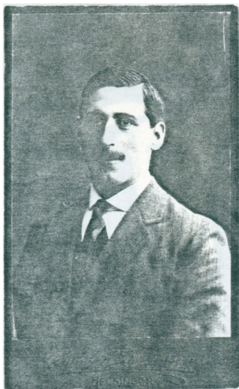
22. Farmors morfar