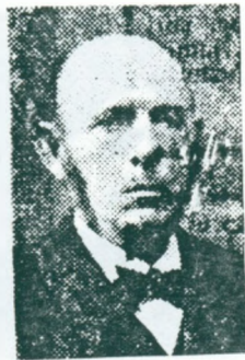
26. Morfars morfar