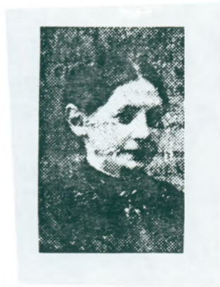
27. Morfars mormor