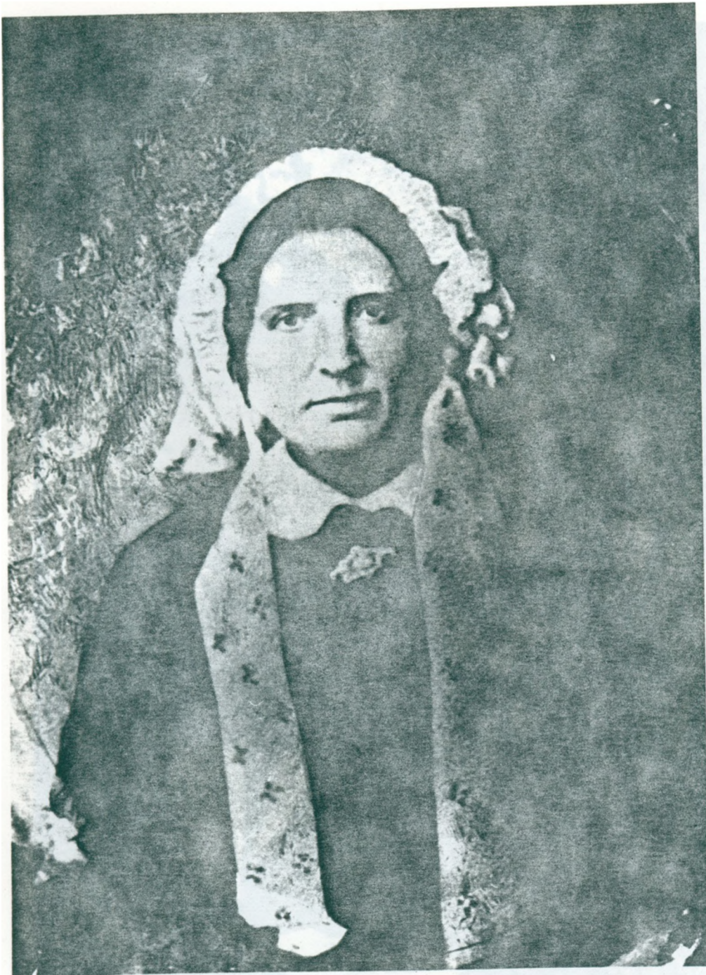
35. Farfars farmors mor