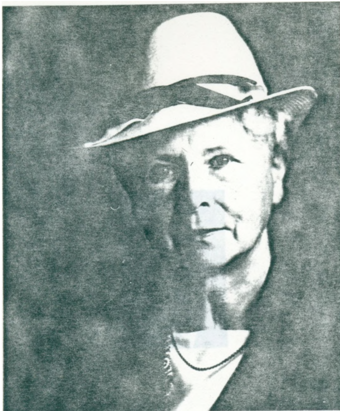
23. Farmors mormor