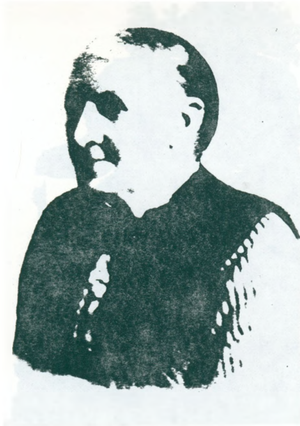
45. farmors morfars mor