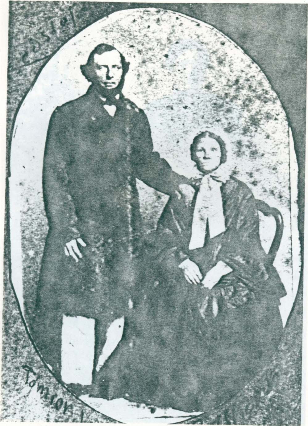
36 og 37: Farfars morfars far og mor