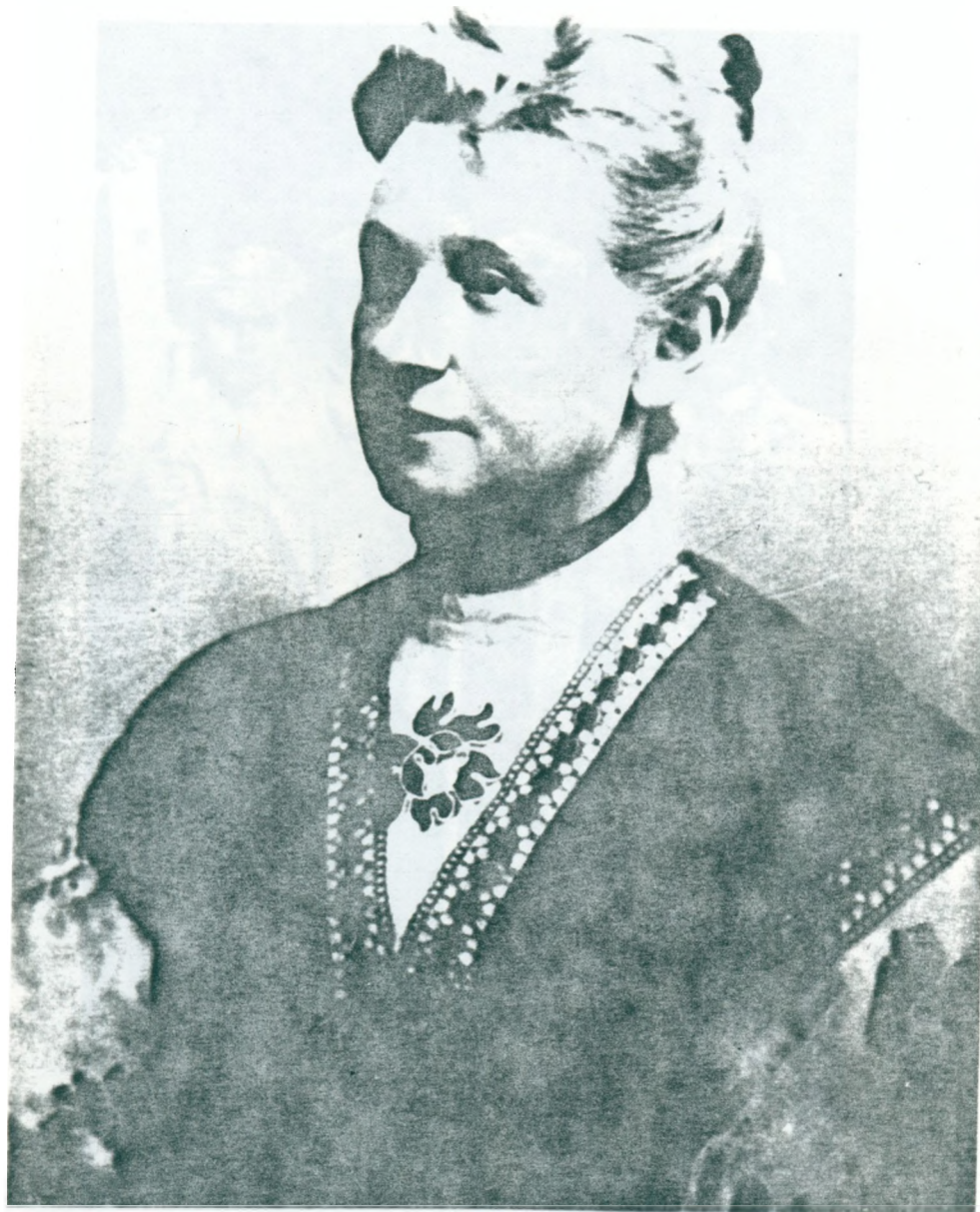
17. Farfars farmor