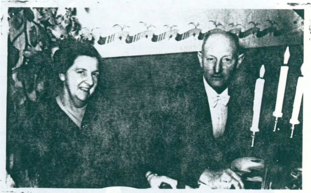
12. Jonathans morfars far og mor