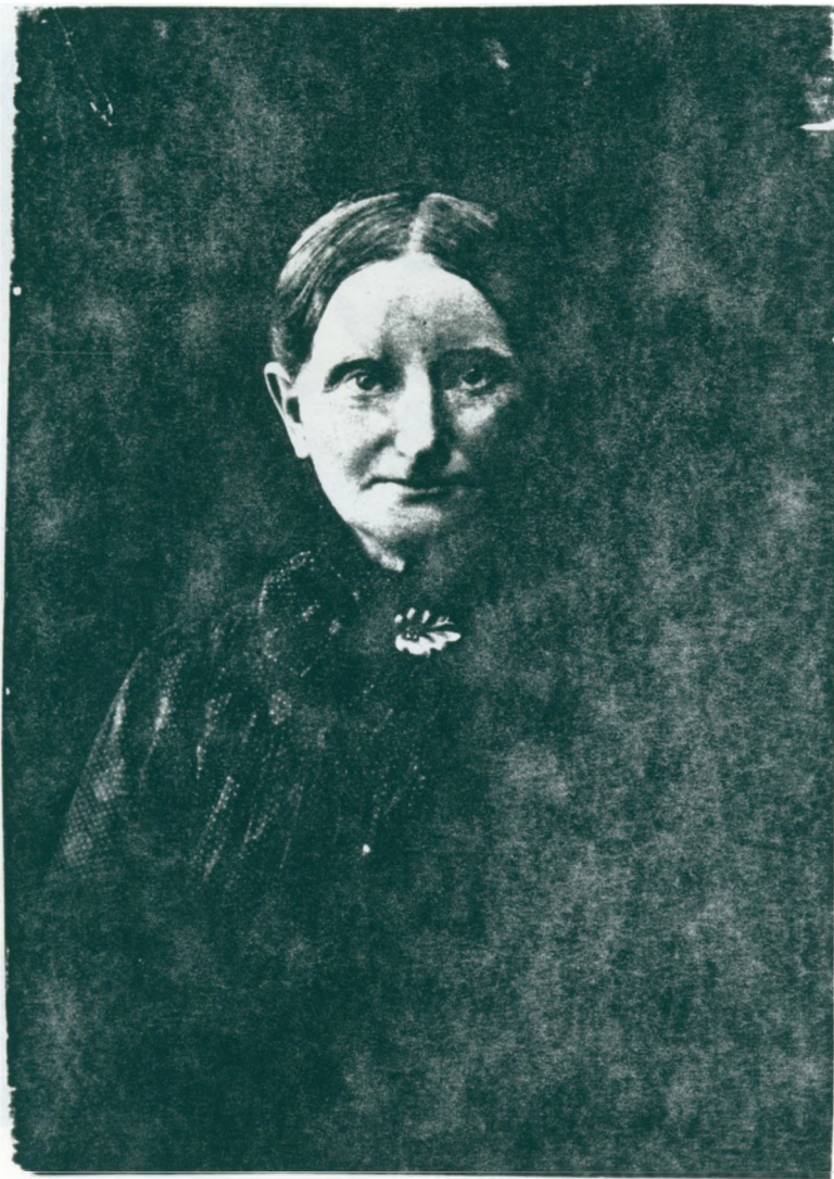
29. Mormors farmor