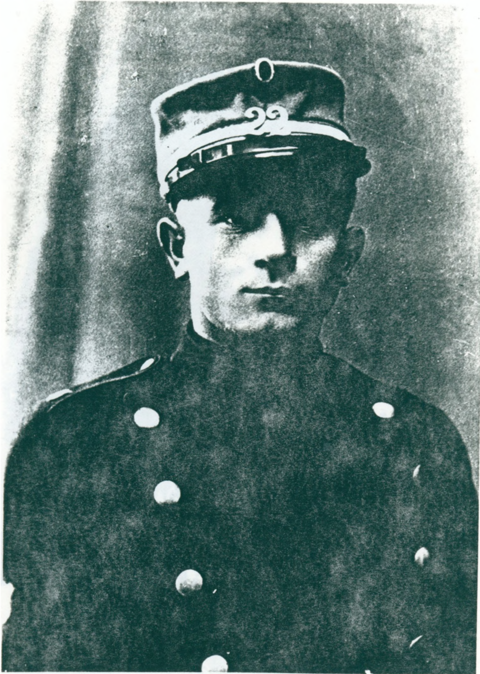
14. Jonathans mormors far