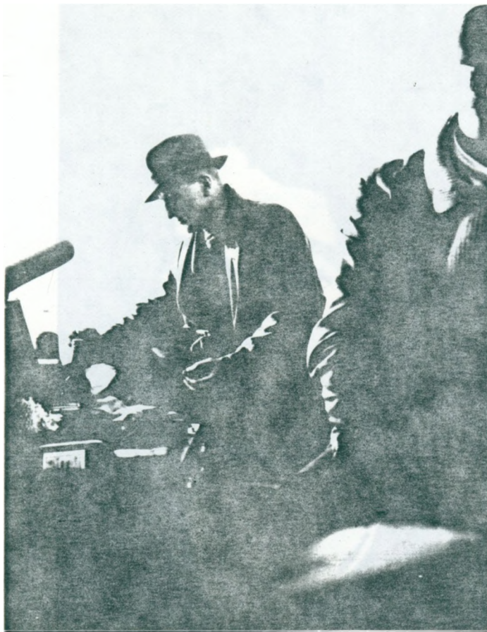
8. Jonathans farfars far