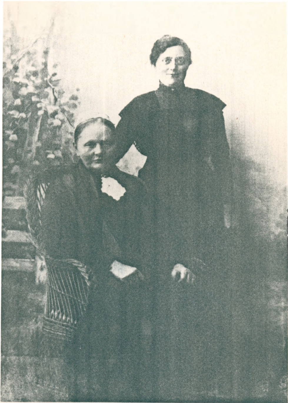
41. Farmors farfars mor