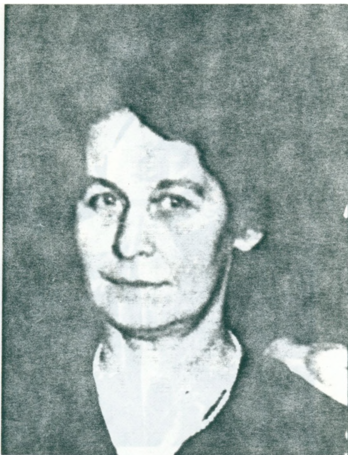
9. Jonathans farfars mor