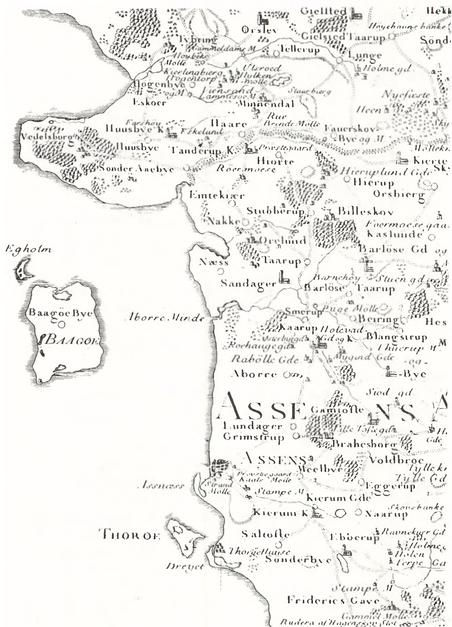
Fig. 1 Udsnit af Videnskabernes Selskabs kort over Det nordlige Fyn 1780 med Holevad og tilstødende bebyggelse. Tegnet af C. Wessel og stukket af Guiter. Gengivet med Geodætisk Instituts tilladelse (A 309/82). Copyright.