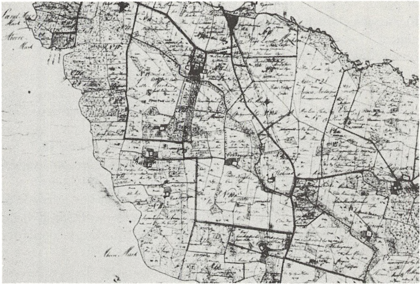
Fig. 3. Udsnit af udskiftningskort over Holevad sogn, Udskiftet 1792 af C. Arnstrop, tegnet af Brun. Matrikeldirektoratet.

dent, udførligt blot to gange i henh. 1809 og 1813, hvor der gives en oversigt over bestanden. At slutte ud fra notaterne har handel ikke haft den store interesse. Priser og køb og salg forekommer hovedsageligt i krigs- og krisetider, hvor forholdene er unormale.