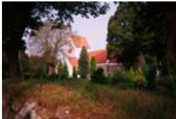
Nautrup Kirke