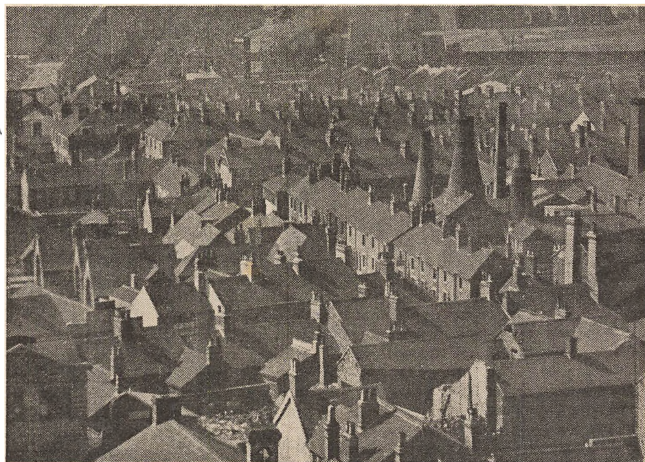
Det England, som kræves dødsdømt.