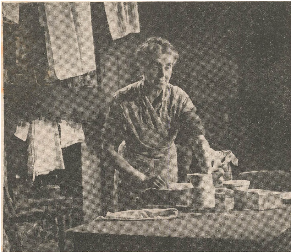
Husmoderen i »Land of Promise« — hun har selv Del i Ansvaret for Tingenes Tilstand.