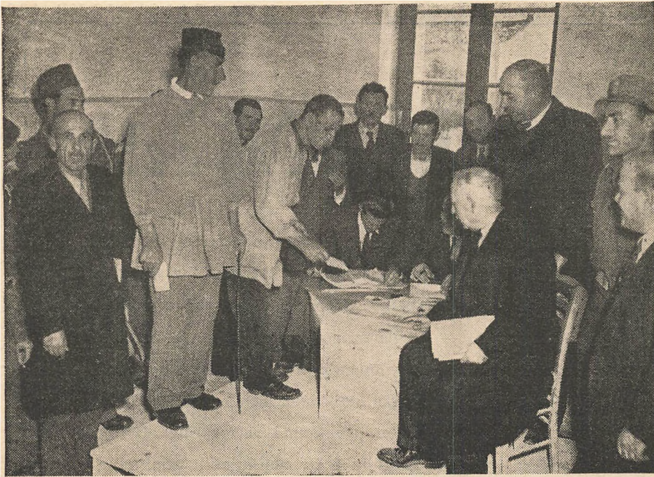
Fra de græske Valg den 31. Marts.