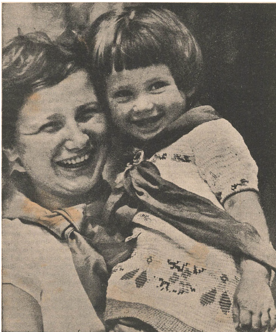
Omsorgen for Mennesket er dikteret af Stalin.

DEN franske Historieskriver Tocqueville skrev engang, at Franskmandene i 1789 gjorde det mest energiske Forsøg noget Folk nogen Sinde har gjort paa at spalte sin Historie i to Halvdele, saa der blev en Kløft mellem hvad der havde været og det, man ønskede skulde gro frem i Fremtiden. Dersom Tocqueville