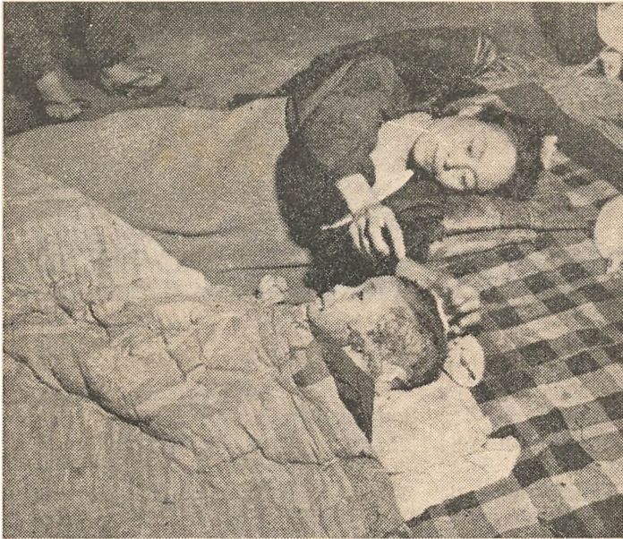
En japansk Dreng, der kom til Skade under Hiroshima-Angrebet. Man ved endnu kun lidt om, hvorledes den menneskelige Organisme paavirkes af de Stoffer, der udløses ved Atombombeekspllosionen.

Der findes et lille Dyr, som i indviiede Krese er mere berømt end Leviathan og Behemoth, end Mammuten og Solenhofer-Skifferbjergets Archæopterix, det vingede Firben. Det er den uanselige lille Bananflue, som producerer en ny Generation hver 14. Dag, og hvis Arveanlæg videreføres ved kun fire Chromosomer. Bananfluen er derfor særlig velegnet til at studere Arvelighedens Love, og ved dette taalmodige lille Dyrs Hjælp er Videnskaben trængt dybt ind i Mutationens Hemmeligheder. — En Mutation er en pludselig indtrædende Forandring i Dyrets Arvemasser. Bananfluernes Mutationsformer viser f. Eks. et Ekstrapar Vinger, slet ingen Vinger eller saadanne af en ny Form o. s. v. Disse Forandringer nedarves ogsaa til nye Slægter. Saadanne Forandringer optræder fra Tid til anden, uden at Videnskaben tidligere har vidst hvorfor. Selv i Dag er vor Kendskab til de mutationsudløsende Faktorer begrænset. Men Eksperimenter med Bananfluen har vist visse ydre Faktors Betydning. Røntgenstråler og Bestraaling med radioaktive Stoffer har vist sig at være i Stand til at mangedoble Mutationernes Indtræden.