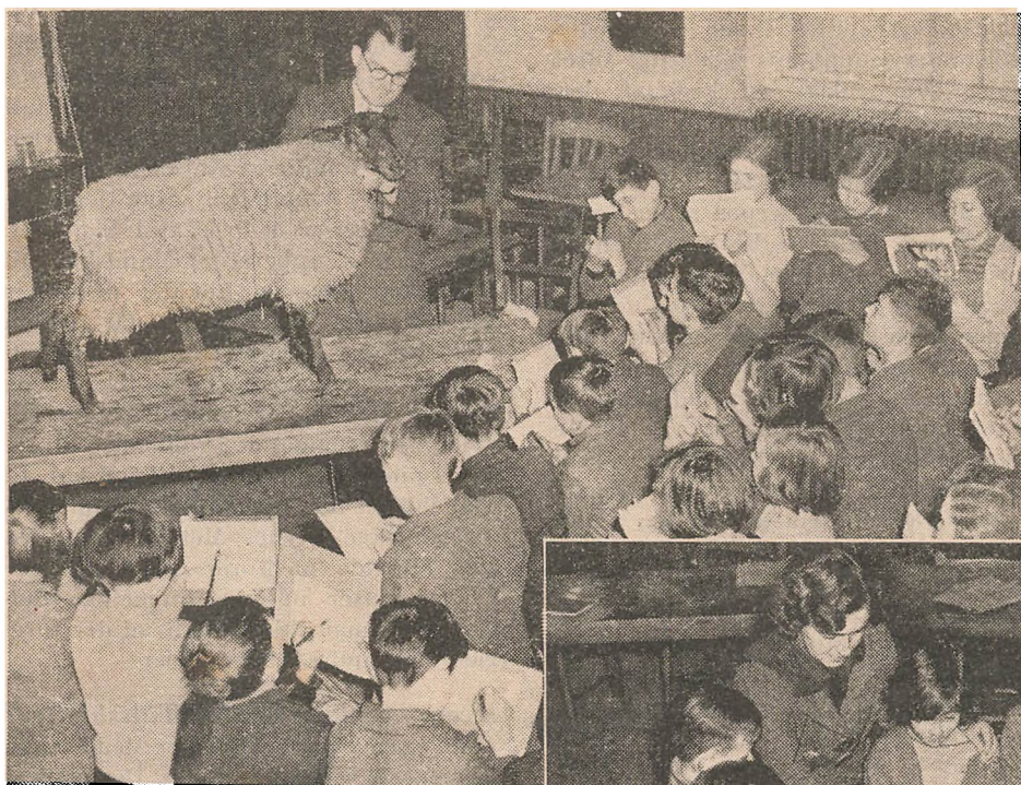
Undervisningen skal gøres levende, jo mindre stift og traditionelt den foregaar, jo bedre. Disse Billeder er fra Amerika, hvor Undervisningen i Naturhistorie synes at være saa levende som man kan ønske sig.